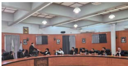
פנייה נרגשת של בעלי מוגבלויות מראש העיר וצוות האכיפה לשמור על ביטחונם