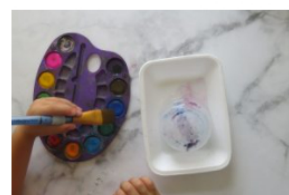
אמנות תהליכית- פעילות מרעננת לימים חמים: