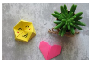
משחק אוריגמי- רגשות ♥