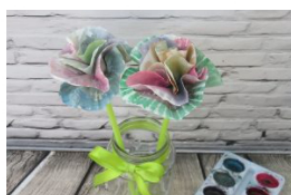
פרחים ממונג'טים :

תמי שלזינגר year ago 1 הגב ל: פנינה נשמעת נסיכה אמיתית הבת שלך! מעלי זה וודאי מאוחר להזמין! החימר הצבעוני - (כמו סילפאטי, אני אוהבת את הקליי של חברת גורי) קונים בכל חנויות יצירה, פעם ראיתי אפילו בחנות הכל בשקל. ולא- הוא לא מלכלך. ממש נעים לעבוד איתו. הגב 0