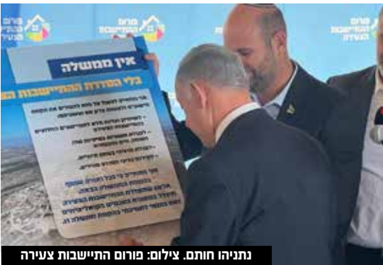
נתניהו חותם.

אשר יאפשרו הקמת ממשלה לאומית אשר תוכל סוף סוף להביא לשינוי משמעותי ביחס להתיישבות בכלל ולהתיישבות הצעירה בפרט". בפורום ההתיישבות הצעירה הזכירו ללוין את ההתחייבות והחתימה של נתניהו על הנוסח הבא: "אני מתחייב לפעול על מנת להשלים את הקמת היישובים ולעשות צדק עם תושביהם: לשיווין זכויות מלא למתיישבים החלוצים בהתיישבות הצעירה. לקבלת תשתיות בסיסיות של: חשמל, מים ותקשורת. לקבלת מרכיבי בטחון חיוניים. לקידום הליכי הסדרה מהירים". "אני מתחייב כי ככל ואהיה שותף בהקמת הממשלה הבאה אדאג שהסדרת ההתיישבות הצעירה תיכלל בהסכמים הקואליציוניים זאת כתנאי לתמיכתי בהקמת ממשלה זו", חתם נתניהו.