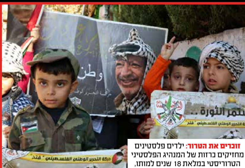
זוכרים את הטרור: ילדים פלסטינים מחזיקים כרזות של המנהיג הפלסטיני הטרוריסטי במלאת 18 שנים למותו, בעיר חברון.