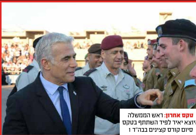
טקס אחרון: ראש הממשלה היוצא יאיר לפיד השתתף בטקס סיום קורס קצינים בבה"ד 1