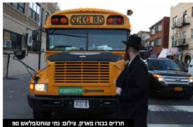
חרדים בבורו פארק.

במרוץ למושלות בניו יורק, למשל, המועמד הרפובליקני לי זלדין, קיבל 85%-95% מהקול החסידי בשכונות בורו פארק ו-ויליאמסבור בברוקלין, ששיעור ההצבעה הממוצע בהן הגיע ל-50%, על פי סקרים מקומיים. זלדין הפסיד לקייטי הוקול