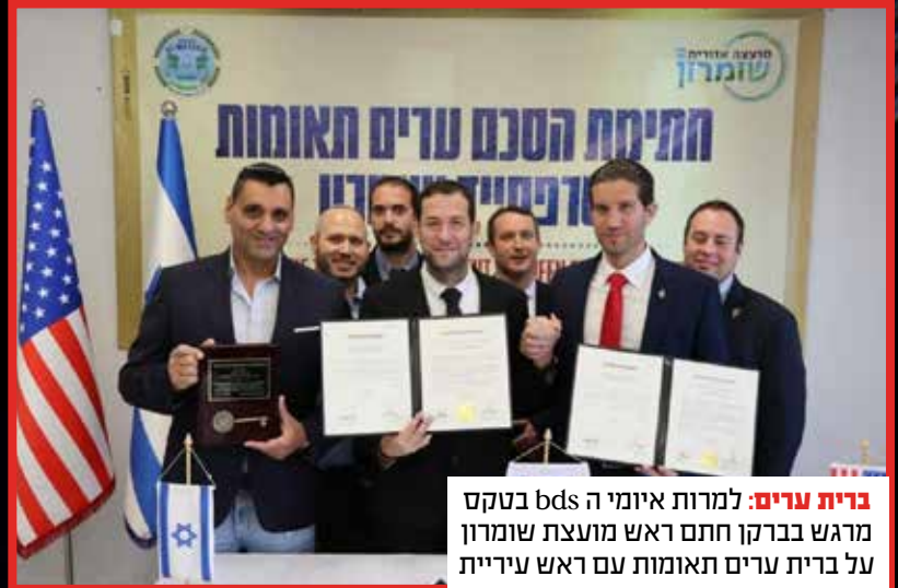
ברית ערים: למרות איומי ה bds בטקס מרגש בברקן חתם ראש מועצת שומרון על ברית ערים תאומות עם ראש עיריית סרספייד במיאמי.