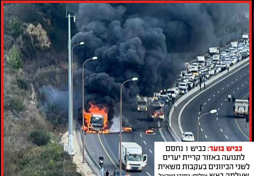
כביש בוער: כביש 1 נחסם לתנועה באזור קריית יערים לשני הכיוונים בעקבות משאית שעלתה באש