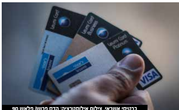
כרטיסי אשראי.

ראשיתה של הפרשה לפני כחודש, עם קבלת דיווח מחברות האשראי בדבר צבר תלונות שהתקבלו מלקוחות, על כך שבוצעו בכרטיסי האשראי שבבעלותם עסקאות חשודות. בתוך כך, חוקרי היחידה החלו באיסוף ממצאים, תוך הפעלת טכנולוגים אמצעים