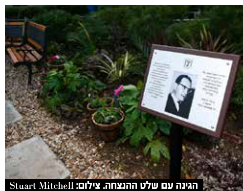
הגינה עם שלט ההנצחה.