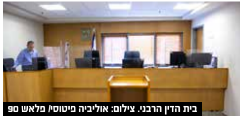
בית הדין הרבני.

אין זו הפעם הראשונה שהרשם מנסה להפוך הקדש דתי לציבורי, ובעניין זה כבר מצוי תזכיר חוק המסדיר את מעמדם של ההקדשות שהקדישו יהודים בבית הדין השרעי בלית ברירה.