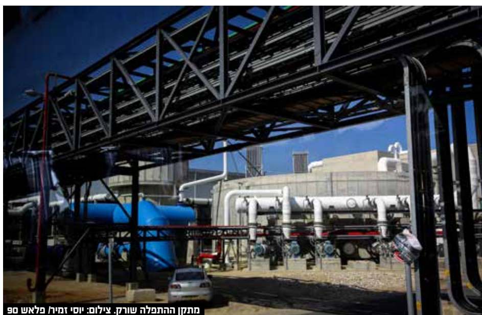
מתקן ההתפלה שורק.

ולתעשייה. לצד החינוכיות שבתוספת המים לאור כשנתיים וחצי, כאשר אספקת המים מהמתקן צפויה להתחיל בשנת 2025.