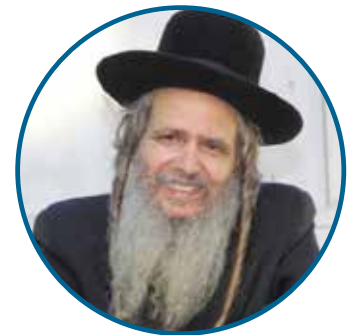
הרה"צ רבי שלום ארוש

הרבה אנשים סובלים לצערנו הרב, במאמר שלפנינו נלמד מה הדבר הרוחני שצריך לעשות כדי להינצל מהייסורים