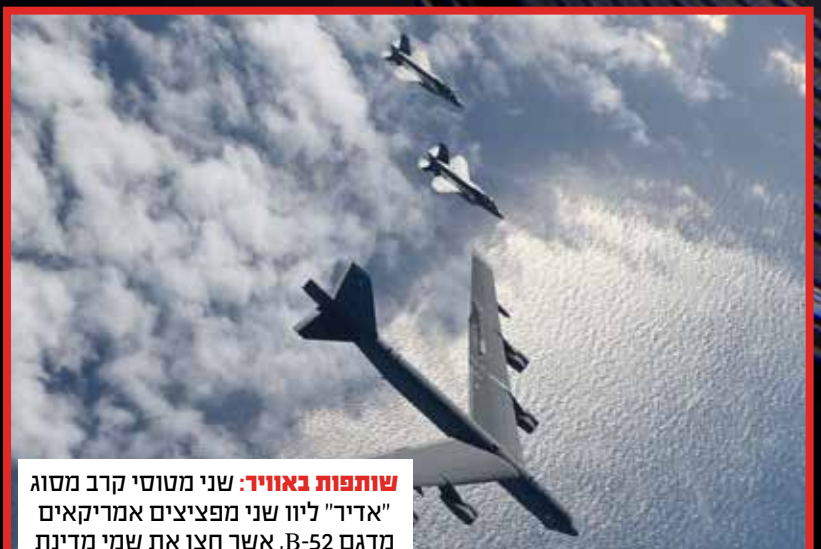
שותפות באוויר: שני מטוסי קרב מסוג "אדיר" ליוו שני מפציצים אמריקאים מדגם B-52, אשר חצו את שמי מדינת ישראל בדרכם מהמפרץ