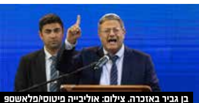
בן גביר באזכרה.

טרוריסטית" עד כה בן גביר לא הגיב למתקפה החריפה והפומבית מצד בכיר כזה בממשל ביידן, וגם במשרד החוץ הישראלי לא הגיבו. מי שמיהר להתייבב לצידו ולהגן עליו הוא חבר הכנסת מיקי זוהר מהליכוד. "הביקורת האמריקאית לא מוצדקת ואינה במקומה. חבל שהם לא בדקו מה היה בעצרת ומה בן גביר אמר בעצרת הזו. זה פשוט עצוב ומיותר", כתב זוהר בטוויטר.