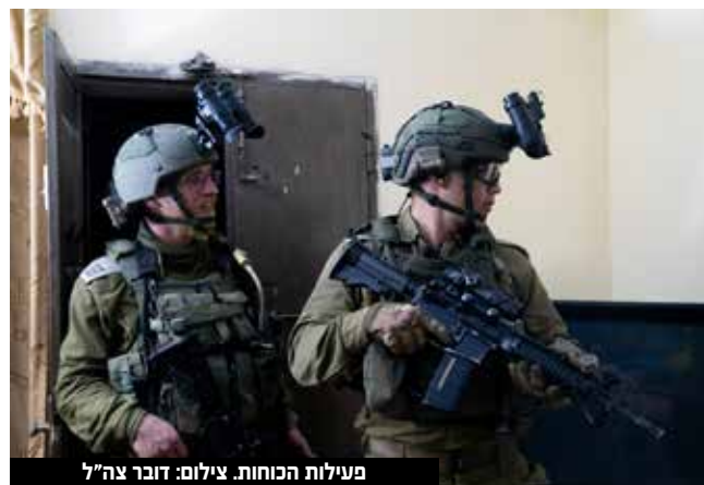
פעילות הכוחות.

ב מ ב י ל , הכוחות פעלו למעצר מבוקש נוסף ולהחרמת נשק בלתי חוקי מסוג "קרלו" בכפר בורקא שבמרחב חטיבת שומרון. כמו כן, נעצרו