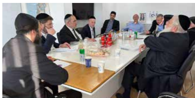
פגישה המו"מ בין יהדות התורה לליכוד

כחלק מהממשל ומתן שמתקיים בימים אלו בין כלל מפלגות הגוש לבין הליכוד, התקיימה פגישה בין צוות המו"מ של יהדות התורה לבין צוות המו"מ של הליכוד, במטרה הליכוד בבניין מצודות זאב. בפגישה הושגה הסכמה חשובה ביותר, בה למעשה יוכפל תקציב המדינה לאברכי כולל ובחורי ישיבות. עם זאת ההכפלה לא תתבצע מיידית. לפי הסיכום בין צוותי הליכוד ויהדות התורה, ערך הנקודה בתקציב יוכפל - כך שאברך כולל יקבל 1,314 שקלים ובחור ישיבה יקבל 730 שקלים. הדרישה הזאת הגיעה גם מצד מפלגות