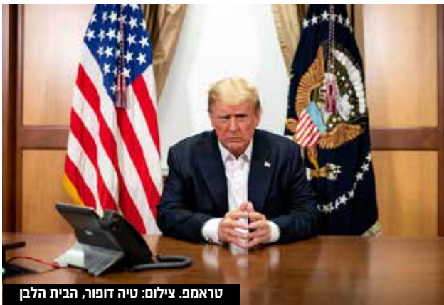
טראמפ.

כתב רשת CNN ג'ים אקוסטה דיווח מפי אחד מיועציו של הנשיא לשעבר כי טראמפ "משתולל וצורח על כולם" בעקבות הכישלון, שרבים במפלגה הרפובליקנית סבורים כי הוא האשם בו. היועץ תקף את בחירת המועמדים של טראמפ שלדבריו "כולם היו גרועים". הוא הוסיף: "זהו המועמד היחיד חשובה". היועץ אמר שטראמפ לא יעכב את הכרזתו על ההתמודדות משום שעיקוב כזה יהיה "מביך מדי".