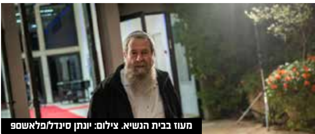
מעוז בבית הנשיא.

סיעת רע"מ הגיעה להתייעצויות בבית הנשיא היום והחליטה שלא להמליץ לנשיא המדינה יצחק הרצוג על אף ח"כ להרכבת הממשלה. משלחת רע"מ לבית הנשיא כללה את ח"כ מנסור עבאס, ח"כ יאסר חוג'יראת וח"כ אימאן חטיב יאסין.