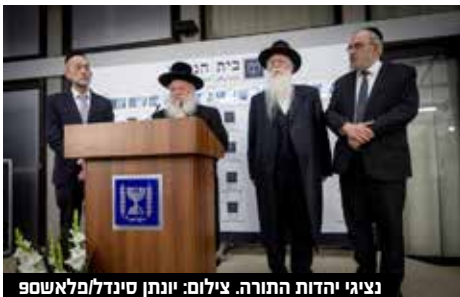
נציגי יהדות התורה.