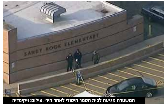
המשטרה מגיעה לבית הספר היסודי לאחר הירי.

על אף הפסיקה, לא ברור כמה מהפיצויים משני המשפטים שנערכו עד כה, ג'ונס מסוגל לשלם. במהלך המשפט באוגוסט, הוא הצהיר כי אין ביכולתו לשלם יותר משני מיליון דולר.