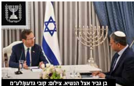
בן גביר אצל הנשיא.