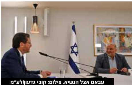
עבאס אצל הנשיא.

בן גביר התייחס גם להר הבית: "הר הבית זה הלב של העם היהודי. ההיסטוריה שלנו מתחילה משם. אנחנו נגד גזענות. אי אפשר להגיד ליהודי אתה