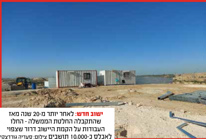
ישוב חדש: לאחר יותר מ-20 שנה מאז שהתקבלה החלטת הממשלה - החלו העבודות על הקמת היישוב דרור שצפוי לאכלס כ-10,000 תושבים