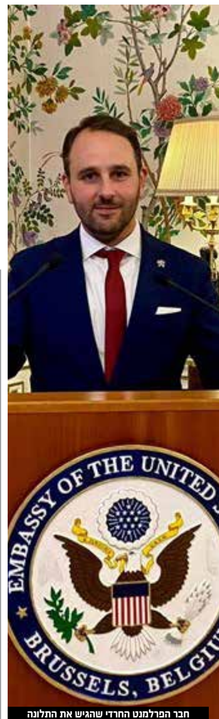
חבר הפרלמנט החרדי שהגיש את התלונה