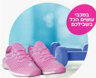
מכבי עושים הכל בשבילכם