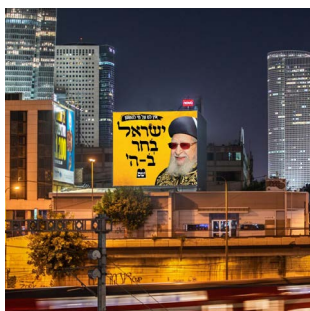
▲ מעלה על נס האמונה. שלטי הקמפיין

בדרכו של מרן רבינו עובדיה יוסף זצ"ל, ובהנהגת נשיא מועצת חכמי התורה גדול הדור מרן ראש הישיבה חכם שלום כהן, מעלה על נס את האמונה והבטחון בקב"ה בייחוד בזמנים קשים, ונושאת תפילה שנצא מהמשבר בדרך הטובה ביותר". פרוסום הקמפיין גרר גל של תגובות חיוביות ומשבחות על המהלך והמסרים, כאשר אנשי תקשורת ויועצים פוליטיים מכל