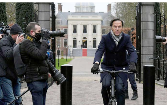
▲ התפטר. מארק רוטה יוצא מארמון המלך

ראש ממשלת הולנד מארק רוטה, המכהן כבר שלוש קדנציות, הגיע רכוב על אופניו למסור את התפטרותו לידי מלך הולנד ויליאם אלכסנדר בהאג, אך ימשיך לכהן בתפקיד עד הבחירות. לאחר ההתפטרות אמר לעיתונאים: "מדובר בעשרות אלפי הורים שנמחצו תחת גלגלי המדינה. לא יכול להיות ספק, זה כתם עצום".