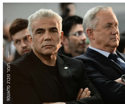
▲ אין מגעים. גנץ ולפיד בימים אחרים

"גורמים רדיקליים מנסים כעת להפעיל לחץ על ראשי הרשויות שלא להשתתף. חלק מאותם גורמים רדיקליים התנגדו להקמת תחנות משטרה בערים ערביות ולא עשו דבר מול משפחות הפשע בחברה הערבית.