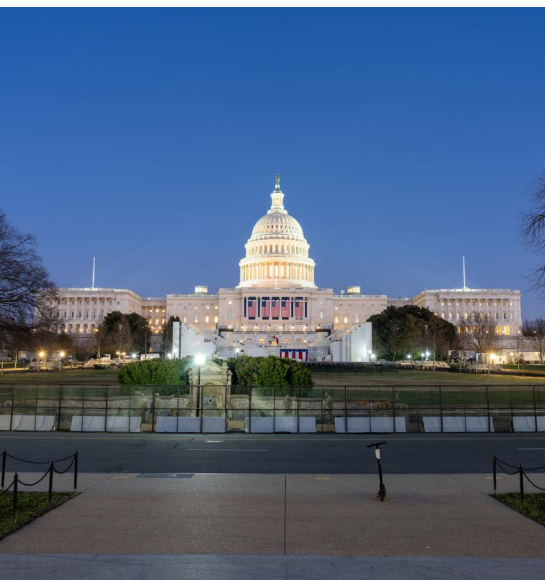
▲ יותר כוחות אבטחה מצופים. הכנות להשבעת הנשיא