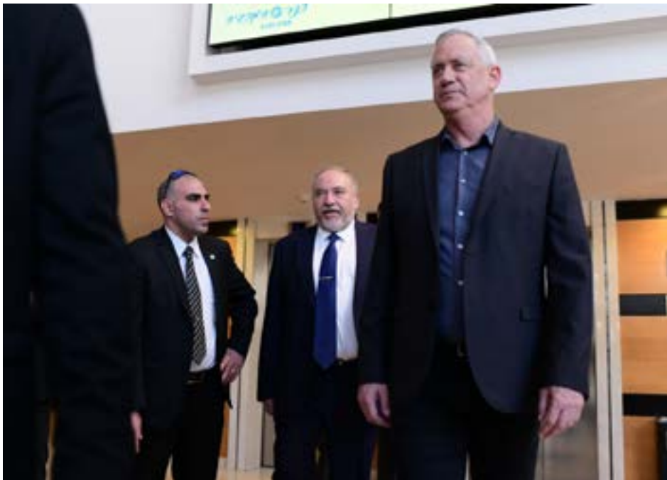
▲ "הפסיד את ההזדמנות". יו"ר כחול לבן גנץ עם יו"ר ישראל ביתנו ליברמן

גנץ עלה גם לראיונות בתקשורת, בהן כבר פנה באופן ישיר אל שותפו בעבר ויריבו בהווה יאיר לפיד, וניסה לשכנע אותו לחבירה מחודשת, תוך שהוא מצהיר כי לפיד ראוי להוביל את מחנה השמאל: "יאיר עשה דרך ארוכה מאוד בפוליטיקה הישראלית והוא יכול לעמוד בראש הגוש. הוא עשה דרך ארוכה, ואם זה מה שנחליט אז כן", אמר גנץ בראיון לכאן ב', "רצנו בסיעה משותפת שלוש