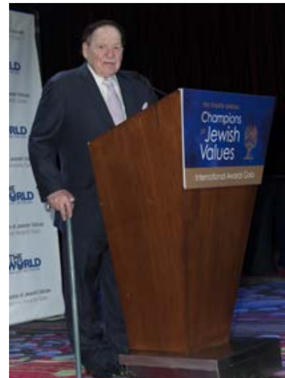
▲ מגדולי הפילנתרופים היהודיים. אדלסון

מבנה המוזיאון קיבל תרומה נכבדה ממשפחה בפורטוגל שמוצאה מדרום מזרח אסיה ושהיו קורבנות מחנות ריכוז ביפן בתקופת המלחמה. בשנת 2013 הקהילה היהודית בפורטו העבירה למוזיאון השואה בושינגטון את כל המוצגים מהארכיון שהתקבלו מפליטים יהודים מתקופת השואה. הארכיון חזר עתה לעיר פורטו והוא כולל מסמכים רשמיים, עדויות, מכתבים ומאות קבצים. במוזיאון מוצגים גם 2 ספרי תורה, שנתרמו על ידי פליטים יהודים מתקופת המלחמה שהגיעו לפורטוגל.