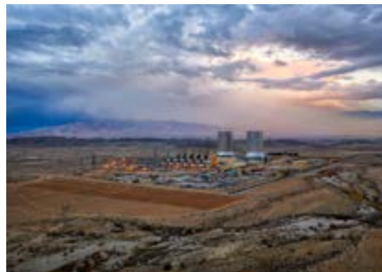
▲ המנהיג העליון לא היה "מרצה". מתקן גרעיני באיראן

על פי הדיווח, פומפאו צפוי למסור פרטים הנוגעים לטענות כי איראן העניקה מקלט בטוח למנהיגי אל קאעידה, ותמיכה לארגון הטרור, וכנראה שימסור מידע חדש על חיסולו של בכיר אל קאעידה אבו מוחמד אל-מסרי, השני בשרשרת הפיקוד בארגון, שחוסל לפני מספר חודשים בטהראן, במבצע שיוחס על פי גורמים זרים לארה"ב ולישראל. יש לציין, כי על פי דיווחים בארה"ב ראש המוסד יוסי כהן השהה בימים אלו בושינגטון נפגש עם פומפאו.