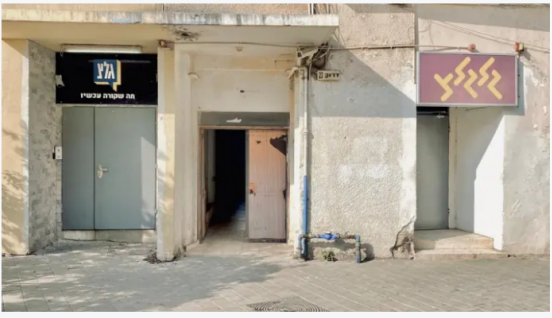
בניין גלי צה"ל

אני זוכר איך עיריית לינור הושעתה משידור בגלי צה"ל אחרי שמתחה ביקורת חריפה על הנשיא ראובן ריבלין, ואיש לא מחה ואיש לא זעק ואיש לא החתים עצומות. אני זוכר באיזו שתקה התקבלה פה התערבות בוסה של הרמטכ"ל גדי איזנקוט בשידורי גלי צה"ל, כשאראל סג"ל שידר שם ביקורת על צמרת הצבא.