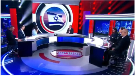
הפטריוטים, ערוץ 14

ואז הגיע לעולם ערוץ 20 (14 של היום), ועבר גם הוא את אותן חוויות, כשסדרת תלונות הונשו נגדו על כל צעד ושעל, תמיד תמיד מצדם של מי שהציגו את עצמם כחסידי חופש השידור.