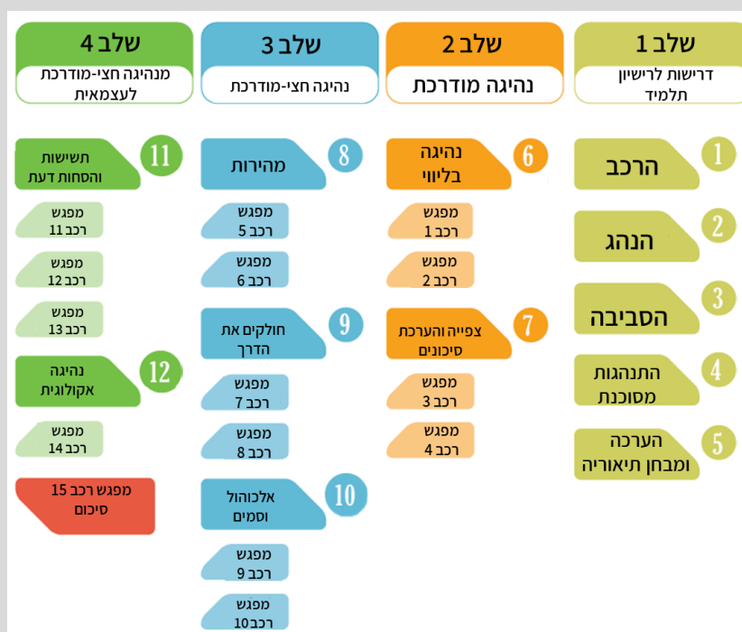
תרשים 1: שלבי הלימוד בקורס לימודי נהיגה, קוויבק 22

דוגמה לשילוב לימודי תיאוריה ולימודים מעשיים – קוויבק: לימודי הנהיגה בקוויבק נעשים בבתי ספר מורשים בלבד ואין אפשרות ללמידה עצמאית. התלמידים נדרשים לקחת קורס של 39 שעות לימוד, על פי החלוקה הבאה: 24 שיעורי תיאוריה בני שעה כל אחד, הנחלקים ל-12 שיעורים נושאים בני שעתיים, ו-15 שיעורים מעשיים (55 דקות כל אחד), המפוזרים בין השיעורים הנושאים. בתרשים 1 להלן מתואר תהליך הלימוד לפי התכנים ואבני הדרך שיש להשיג בכל אחד מהשלבים.