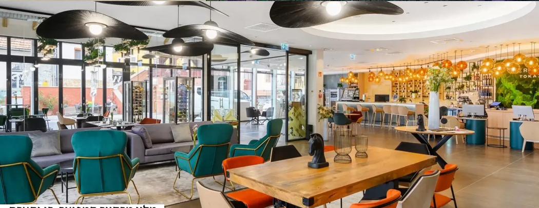
מלון מרקור המפואר, בו נתארך