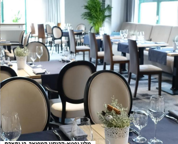
מלון נפטא-קרוסנו המפואר, בו נתארח