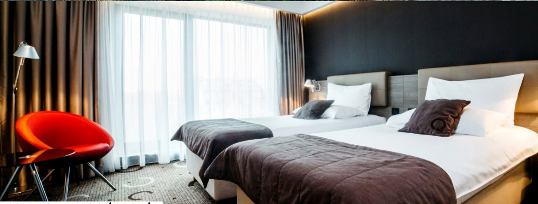
מלון קיז פלוס המפואר, בו נתארך

המראה: ריינאיר 7161 בשעה 15:00 נחיתה משוערת: טרמינל 3, בשעה 19:20 בערב.