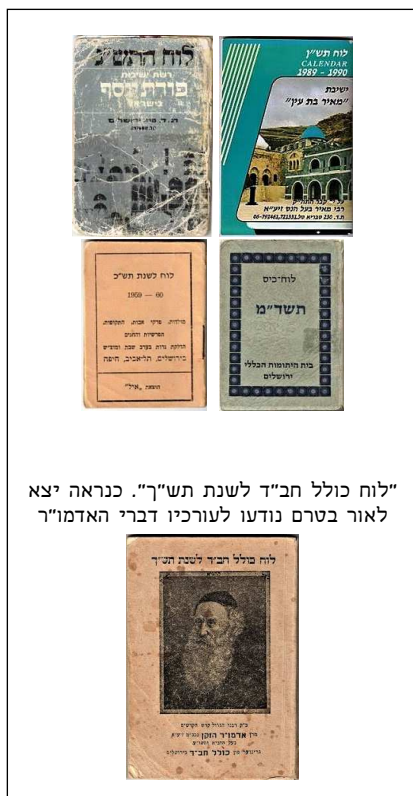
"לוח כולל חב"ד לשנת תש"ר". כנראה יצא לאור בטרם נודעו לעורכיו דברי האדמו"ר

מסתבר, שאף בנושא זה (שאינו ממש ברומו של עולם...) נכתבה ספרות ענפה. בכתיבת הדברים לא התיימרתי להקיף את כל הנכתב בנושא זה. דִּינּו, לעת עתה, בהפניה לדבריו של אבינרי 42 , שתיאר כיצד לאורך כל שנת ה'תש"כ, וגם מעט לפני ולאחריה, נאבק בִּמְצִייתִים להכרעת האקדמיה. בדבריו מוזכרות במות עיתונאיות ואחרות שעל גביהן השתרע הפולמוס-זוטא בנושא זה באותה תקופה, בליווי תיאור קצר וחד-לשון של התפתחותו.