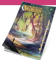
מנוי למגזין השראה

רכשו את הספר 'שישים שניות בדקה', חפשו בתוכו שובר מתנה. מצאתם שובר? חייגו 073-7961336 שלוחה 3. הציגו מספר חשבונית וקבלו: