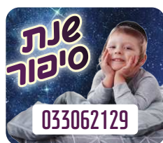
מנוי לשנת סיפור