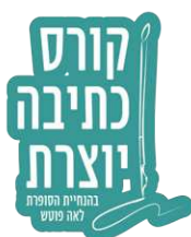
קורס כתיבה יוצרת