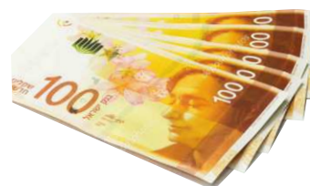
500 ש"ח במזומן