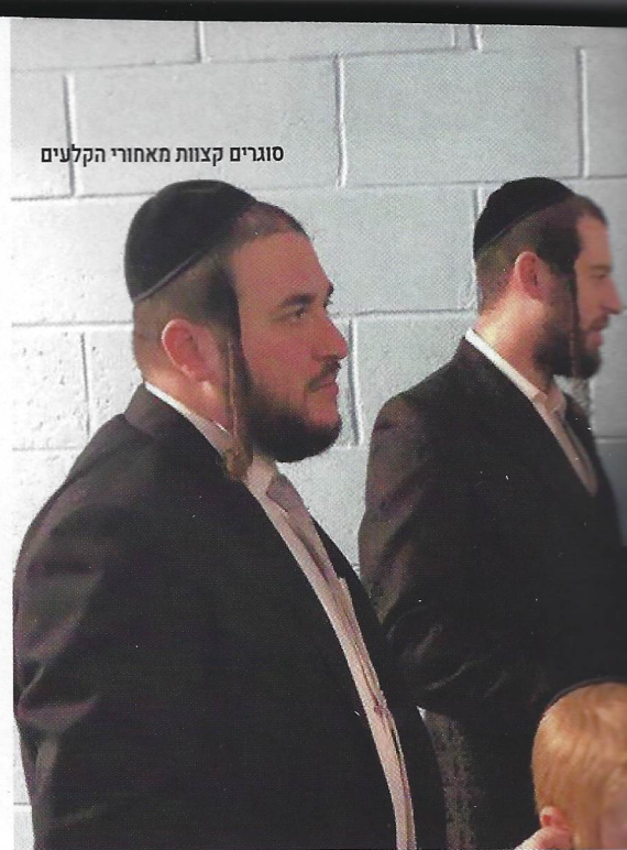
סוגרים קצוות מאחורי הקלעים

מעולם לא אמרתי למישהו שהגיע אלי - 'האלט זיך רואיג'. התפקיד והשאיפה שלי הם לחפור ולהגיע לשורש הענין 'מדוע' הוא סובל מאומרואיגקייט (חוסר מרגוע) בכלל. ולהגיע למצב שהאדם ירגיע את עצמו בכוחות עצמו. זוהי תמצית השיטה.