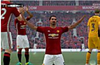
חיסול EA Games מפתיעה: להיטי 2016 במכירת