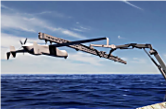
מאויישים באוויר צפו: הטכנולוגיה שתופסת מטוסים בלתי