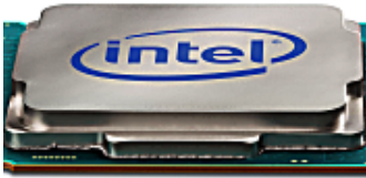
כל המעבדים החדשים של אינטל במקום מרוכז אחד