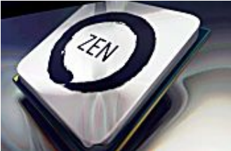
מעבדי ה-Zen של AMD: מחירים גבוהים מהצפוי?