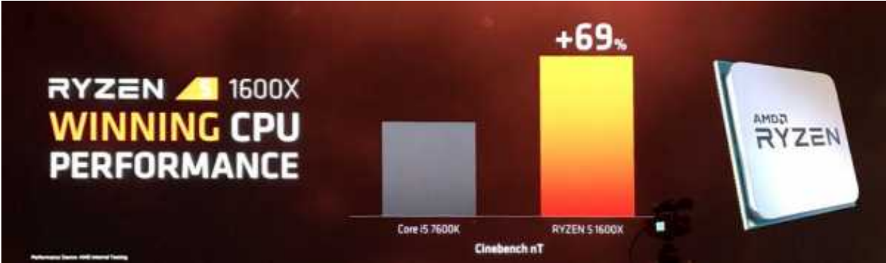
תוצאות Cinebench אינן חוות הכל – אבל אנחנו בכל זאת מתרשמים מאוד מההיצע שבדרך