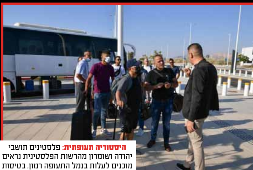
היסטוריה תעופתית: פלסטינים תושבי יהודה ושומרון מהרשות הפלסטינית נראים מוכנים לעלות בגמל התעופה רמון, בטיסות מיוחדות לאנטליה שבטורקיה.