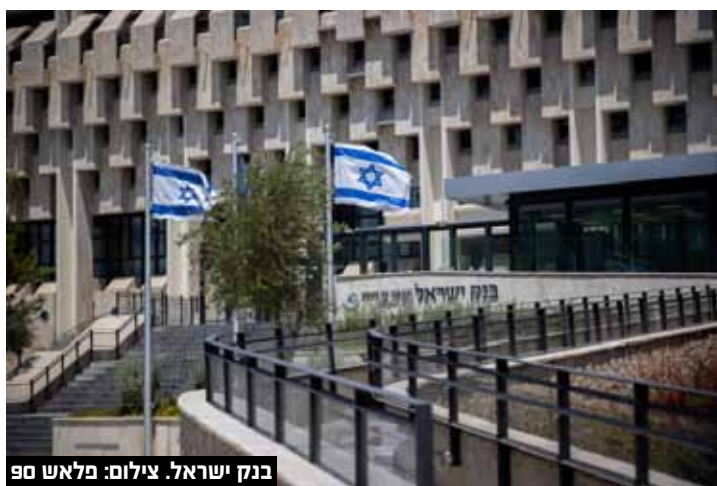
בנק ישראל.

נוכרי כי בחודש אפריל העלה בנק ישראל את הריבית משיעור השפל בכל הזמנים של 0.1% לשיעור של 0.35%, ובכך פתח בעידן חדש של העלאות ריבית. בחודש מאי הקפיץ הנגיד את הריבית הבסיסית במשק ב-0.4% נוספים לשיעור של 0.75%, ביולי עלתה הריבית בעוד 0.5% ועמדה על 1.25%. העלאת הריבית מתכתבת עם העלאות ריבית דומות במדינות רבות בעולם, שהחלו בהעלאות הריבית הראשונה בבריטניה בחודש דצמבר האחרון. מאז הועלתה הריבית במדינות רבות בשלוש, ארבע ואף בחמש פעימות, בשיעורים שבין 0.25% ל-1%, ובשל התפרצות האינפלציה ברחבי העולם, בשיעורים שלא היו בחלק מהמדינות בין 20 לכ-40 שנה - הריביות צפויות