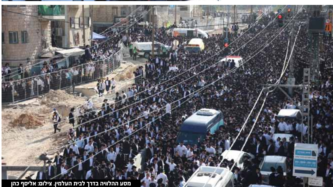
מסע ההלוויה בדרך לבית העלמין.