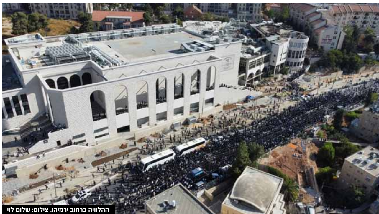
ההלוויה ברחוב ירמיהו.

הכי קשה שלנו, עם מי נתייעץ? מי יורה לנו את הדרך מי ינחה אותנו. ה' נתן ה' לקח יהי שם ה' מבורך, אנחנו מקבלים את הדין אבל קשה לנו. כמו אהרן הכהן לא שינה, במשך עשרות שנים. בשבוע שעבר כתב לי מקורבו של הרב שך זצ"ל, שהרב שך אמר לו ש'הלוואי עלינו האשכנזים רב כמו חכם שלום'. הרב שך אמר שחכם שלום היה איש אמת ללא נגיעות. זה כל כך נכון, היה איש אמת והכול בדרכי נועם ובאהבה. אחרי הסתלקות הסמל של האמת מי יורה לנו את האמת? אנחנו מבקשים ממך רבינו הגדול שתרחם עלינו בשמיים ביחד עם מרן, עם רבינו עובדיה יוסף שכל כך אהב אותך והיה קשור אליך. היה קורא לך 'דיד בן ידיד', תעמדם ביחד בכסא הכבוד ותתפללו שתושיע אותנו. מבקשים ממך סליחה ומחילה שלא נהגנו כך מספיק כבוד, מרוב צניעות. פעמים רבות התווכחנו, בפרט בתקופה האחרונה בזמן הטיפולים, אבל הכול עשינו בשבילך. מזכיר כאן את בתך וחתנך שעשו הכול לכבודך, ימים ולילות, כל עם ישראל חייב להם. התנועה הקדושה שייסדת, שניהלת, רוממת וביססת, שהקדוש ברוך הוא יזכה שנמשיך להגדיל תורה ולהאדירה, לשמור על עולם התורה ולזכות במשיח צדקנו".