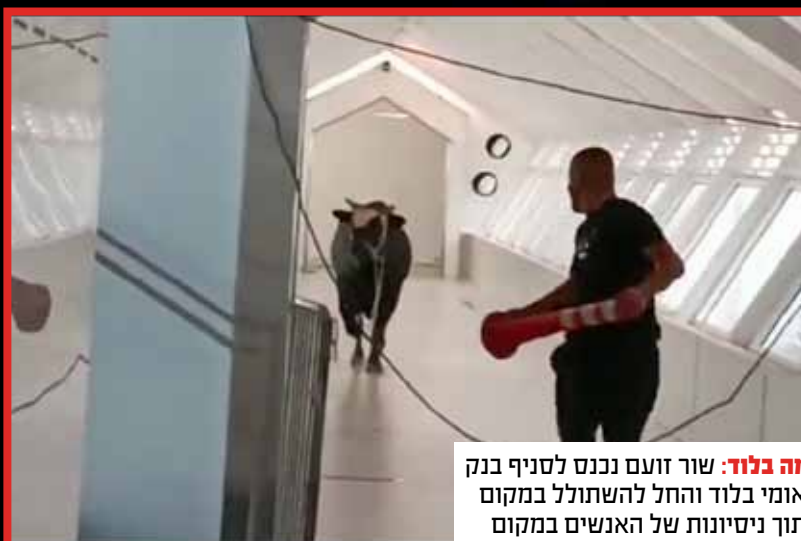
אימה בלוד: שור זועם נכנס לסניף בנק לאומי בלוד והחל להשתולל במקום תוך ניסיונות של האנשים במקום להרגיעו ולהוציא אותו מהמתחם.