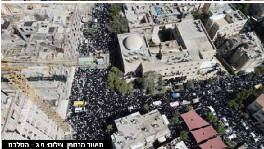
תיעוד מרחפן.