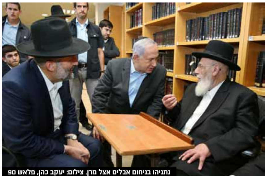
נתניהו בניחום אבליים אצל מרן.

גם במערכת הפוליטית הגיבו בצער ובתדהמה עם הידוע דבר הסתלקותו של מרן זצוק"ל. מרן זצוק"ל היה מוקד עליה לרגל גם עבור המערכת הפוליטית. רבים מהפוליטיקאים בישראל נהגו להסתופף בצילו ולהיועץ עימו במגוון נושאים. מרן קיבל את כולם בסבר פנים. נשיא המדינה יצחק הרצוג כתב: "אני אבל על לכתו מעייננו של ראש הישיבה הדגול חכם שלום כהן זצ"ל. לצד גדלותו בתורה, הוא היה מנהיג רוחני שהוביל בענווה ובצניעות ציבור גדול וחשוב בישראל ובעולם היהודי. נפגשנו פעמים רבות, וצר לי שהשנה לא אזכה לקיים המסורת ולבקר אותו בסוכתו. בכל