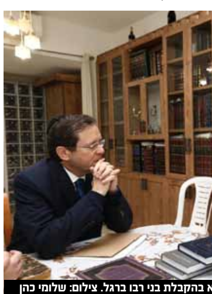
הנשיא בהקבלת בני רבו ברגל.

שר הביטחון בני גנץ: "נצחו אַרְאָלִים אֶת הַמְצֻקִים. צער עמוק על מותו של חכם שלום כהן זצוק"ל, נשיא מועצת חכמי התורה. משתתף יחד עם כל אזרחי ישראל בצער משפחתו, אוהביו ומאמיניו. כל בית ישראל יבכו את השריפה אשר שרף ה'".