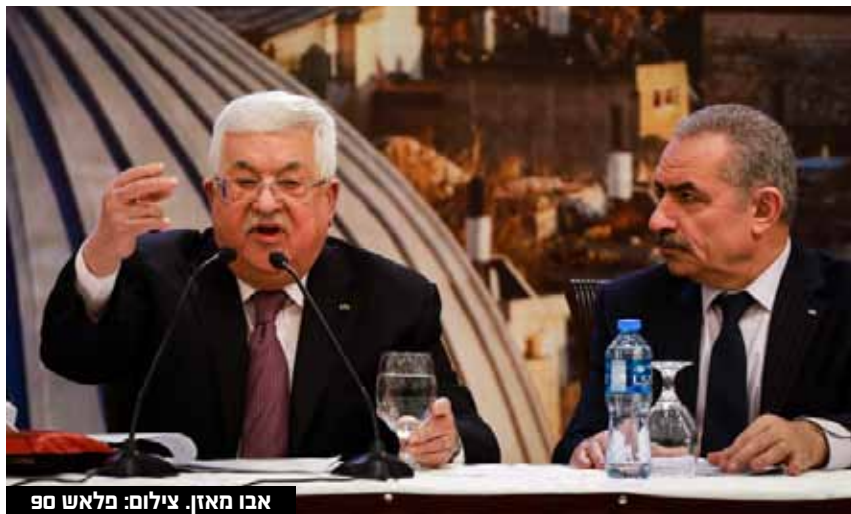
אבו מאזן.

שגורמים איראניים ורוסיים ינסו להתערב בבחירות. החשש הוביל ל"מבצע למען הדמוקרטיה", שמתמקד בעיקר בגורמים איראניים ורוסיים שמנסים לפי החשד לייצג כאוס וקיטוב בישראל באמצעות פעילות שמתמקדת בעיקר ברשתות החברתיות. הזירה המרכזית שדרכה מנסים להשפיע על הבחירות היא פעילות של בוטים ומשתמשים מזויפים, שמנסים להביא לתסיסה בתוך החברה בישראל. בבחירות הקודמות, לפני יותר משנה, הסבב בשב"כ 140 אלף בוטים איראניים. לקראת הסבב הנוכחי, המאבק מתחדש: בשב"כ החלו כבר לטפל בחלק מהגורמים הזרים שמנסים להטות את הבחירות. ברשות הפלסטינית אמרו בתגובה, שגם לפני הפרסום וגם אחריהם הם הבהירו לנציגים הישראליים שאין כל כוונה לרשות להתערב בבחירות ושכל הפגישות שמתנהלות עם חברי הכנסת, בין אם ערבים ובין אם יהודים, הן שיחות פוליטיות רגילות ולא מעבר לכך.