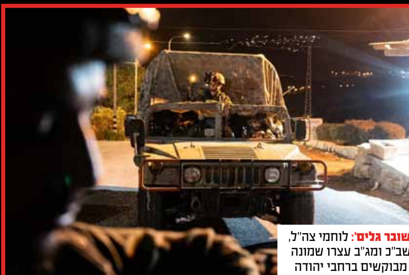
שובר גלים: לוחמי צה"ל, שב"כ ומג"ב עצרו שמונה מבוקשים ברחבי יהודה ושומרון.