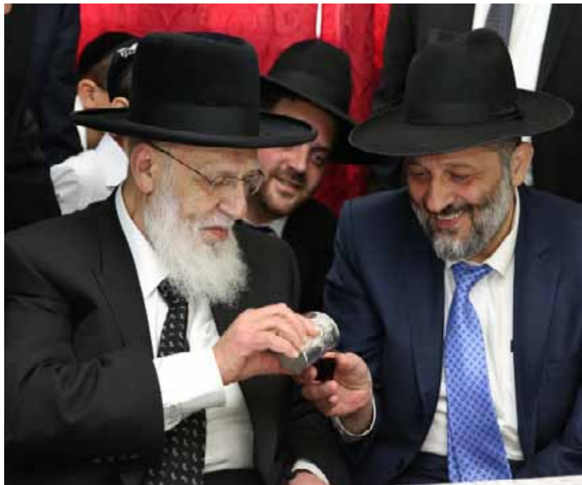
דרעי ומרן זצוק"ל.

ח"כ משה אבוטבול ש"ס: "אבי אבי רכב ישראל ופרשיו. שר גדול נפל בישראל. נצחו אראלים את המצוקים ונשבה ארון ה'. מורנו ורבינו מרן ראש הישיבה הכהן הגדול חכם שלום כהן זצוק"ל נשיא מועצת חכמי התורה. נפלה עטרת ראשנו אוי לנו כי