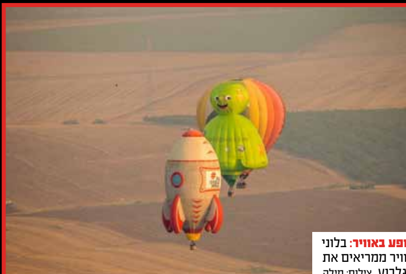
מופע באוויר: בלוני אוויר ממריאים את הגלבוע.