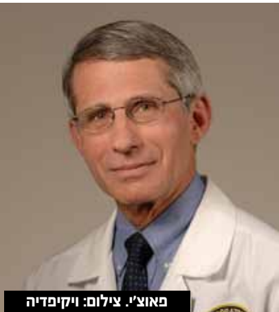
פאוצ'י.

כרופא במכונים הלאומיים לבריאות (NIH) בארצות הברית, פאוצ'י עוסק בבריאות הציבור בתפקידים שונים למעלה מחמישים שנה. הוא תרם למחקר מחלות רבות של המערכת החיסונית, הן כמדען והן כראש NIAID ב-NIH. הניו יורק טיימס כינה את פאוצ'י "המומחה המוביל במדינה למחלות זיהומיות".