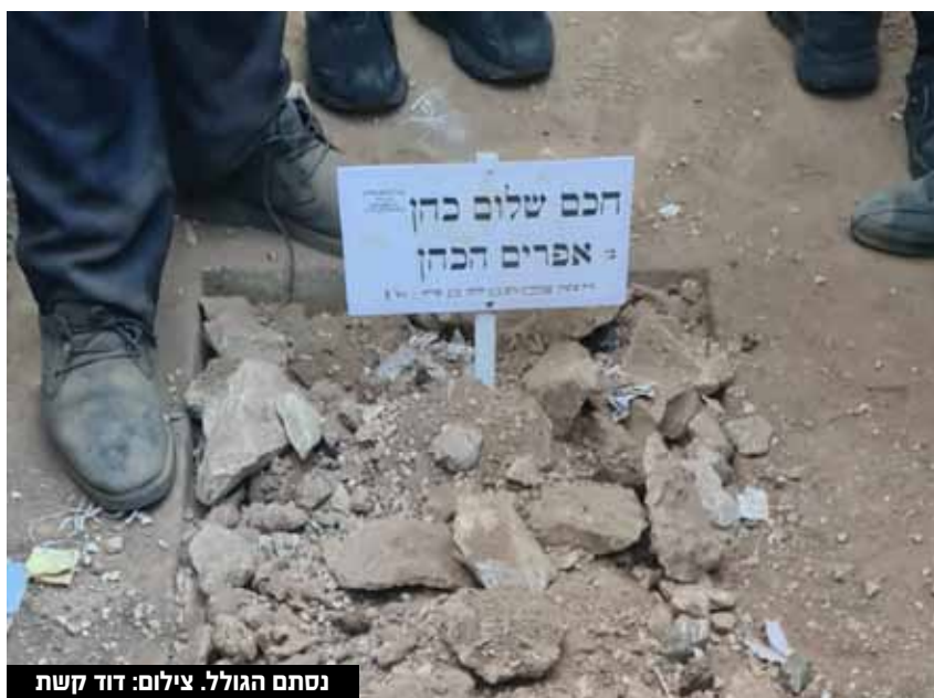
נסתם הגולל.

הכי קשה שלנו, עם מי נתייעץ? מי יורה לנו את הדרך מי ינחה אותנו. ה' נתן ה' לקח יהי שם ה' מבורך, אנחנו מקבלים את הדין אבל קשה לנו. כמו אהרן הכהן לא שינה, במשך עשרות שנים. בשבוע שעבר כתב לי מקורבו של הרב שך זצ"ל, שהרב שך אמר לו ש'הלוואי עלינו האשכנזים רב כמו חכם שלום'. הרב שך אמר שחכם שלום היה איש אמת ללא נגיעות. זה כל כך נכון, היה איש אמת והכול בדרכי נועם ובאהבה. אחרי הסתלקות הסמל של האמת מי יורה לנו את האמת? אנחנו מבקשים ממך רבינו הגדול שתרחם עלינו בשמיים ביחד עם מרן, עם רבינו עובדיה יוסף שכל כך אהב אותך והיה קשור אליך. היה קורא לך 'דיד בן ידיד', תעמדם ביחד בכסא הכבוד ותתפללו שתושיע אותנו. מבקשים ממך סליחה ומחילה שלא נהגנו כך מספיק כבוד, מרוב צניעות. פעמים רבות התווכחנו, בפרט בתקופה האחרונה בזמן הטיפולים, אבל הכול עשינו בשבילך. מזכיר כאן את בתך וחתנך שעשו הכול לכבודך, ימים ולילות, כל עם ישראל חייב להם. התנועה הקדושה שייסדת, שניהלת, רוממת וביססת, שהקדוש ברוך הוא יזכה שנמשיך להגדיל תורה ולהאדירה, לשמור על עולם התורה ולזכות במשיח צדקנו".