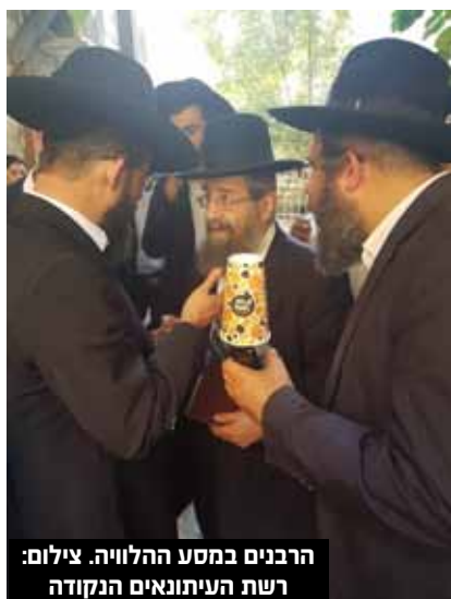
הרבנים במסע ההלוויה.

הראשון לציון הגאון רבי יצחק יוסף אמר בהספדו: "יהושע היה בוכה ימים רבים על משה רבינו, והקדוש ברוך הוא הצטרף אליו. הדור כולו הפסיד את המנהיג שלו, אין ממי לקבל דעת תורה ואין עם מי להתיעץ. יהושע היה בוכה על כך שלא היה לו עם מי להתיעץ, והקדוש ברוך הוא נגלה אליו ואמר לו