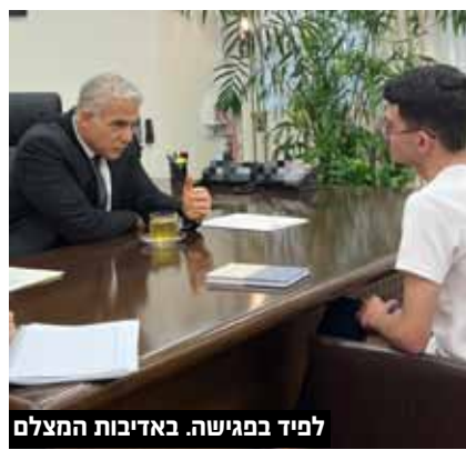
לפיד בפגישה

לדברי לפיד, במהלך הפגישה, "אני לא אוהב את הדרך שבה מדברים על המורים הוותיקים במשא ומתן הזה. המורים הוותיקים הם אנשים שחינוך פה דורות של תלמידים, שהפקדנו בידיהם את הילדים שלנו. החברה הישראלית צריכה לשאת אותם על כפיים. הם לא נטל על המערכת הם עמוד התווך, הם אנשים שהקדישו את חייהם לחינוך. אין דבר יפה מזה". יו"ר מועצת התלמידים והנוער הארצית רן שי, הוסיף: "בראש סדר העדיפויות צריכים להיות ערכים והקניית מיומנויות, הערכים לא משתנים ונותנים יציבות בתוכנו. אני מאמין שהנוער צריך להיות בכל שולחן קבלת החלטות. אני כאן אצלך, מוכן להתגייס