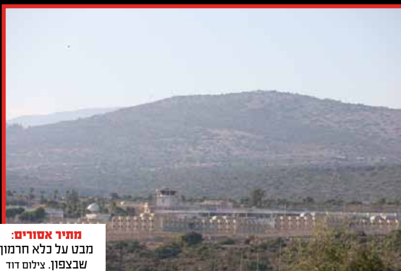
מתיר אסורים: מבט על כלא חרמון שבצפון.