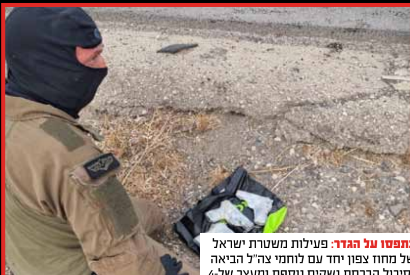
נתפסו על הגדר: פעילות משטרת ישראל של מחוז צפון יחד עם לוחמי צה"ל הביאה לסיכול הברחת נשקים נוספת ומעצר של-4 חשודים.