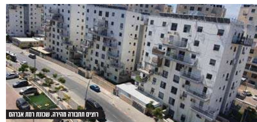
רוצים תחבורה מהירה. שכונת רמת אברהם

"דרך של 7 דקות הופכת לנסיעת סיטוט של 45 דקות", טוענים עסקני התחבורה ברמת אברהם