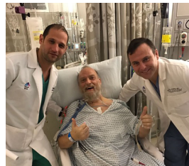
אינדערפרי נאכ'ן אפעראציע

אידעלע, גערעכט, נישט אלעמאל איז גוט ליידער מאכן אידן אויפיל מיט, צרות, נסיונות געפערליך אויפ'ן הארץ איז דאך אזוי שווערליך דיין אייבערשטער שטאמ, מוז זיין אז ס'איז גוט.