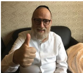
א וואך נאכ'ן אפעראציע