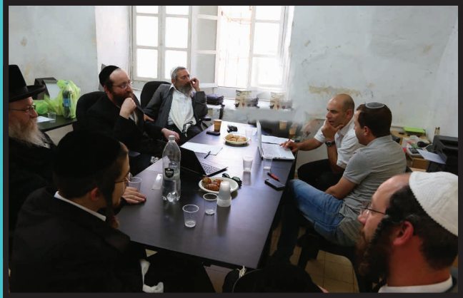
אסיפות התייעצות של רבנים ועסקנים עם צוות עורכי הדין המלווים את כל פעילות מטה ההסברה