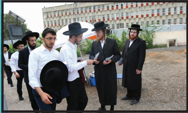
אברכים מחלקים חוברת הדרכה מפורטת לקבוצת בחורי ישיבה