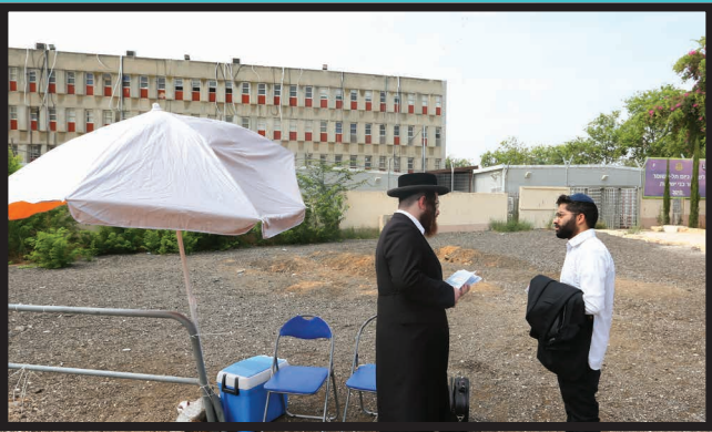
אברך מתנדב בהדרכה מפורטת לבן ישיבה