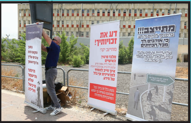
שוטרים שמגיעים לשטח כדי להפריע לפעילות