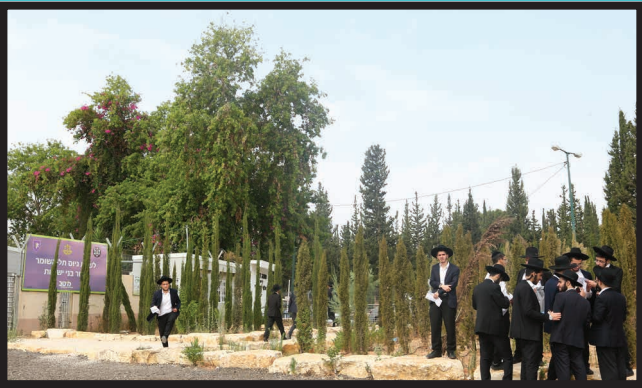
בחורי ישיבה מעיינים בכובד ראש בחוברת ההדרכה