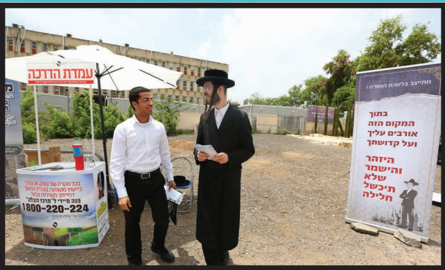
השארות פרטים אצל המתנדבים למעקב ולטיפול ע"י צוות העו"ד