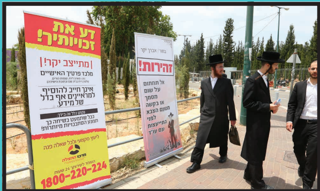
המתנדבים עוצרים כל בחור כדי לברר אם יש בידו כל המסמכים