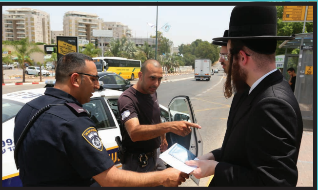
השוטרים נותנים דו"ח לאברכים שישולם ע"י מטה ההסברה

את טופס הדיחוי, מוחקים דברים בטופס וכותבים דברים שיסבכו את מוסר הדיחוי. היה זה ממש בשבועות האחרונים, הבחינו המתנדבים שבמקום בו מצויין שהבחור לומד "כל היום", נמחקו המילים, וכתבו במקום זה "חצי יום". הבחור כלל לא בדק את הדיחוי, כי סמך בעינים עצומות על המעניקים שבודאי לא יעשו דבר שאינו טוב עבורו, למעשה הגשת דיחוי שכזה, פירושו איבוד מייד של מעמד בן ישיבה. עקב בעיות מסוג זה בודקים המתנדבים את הטופס לוודא שהכל נכתב כנדרש.