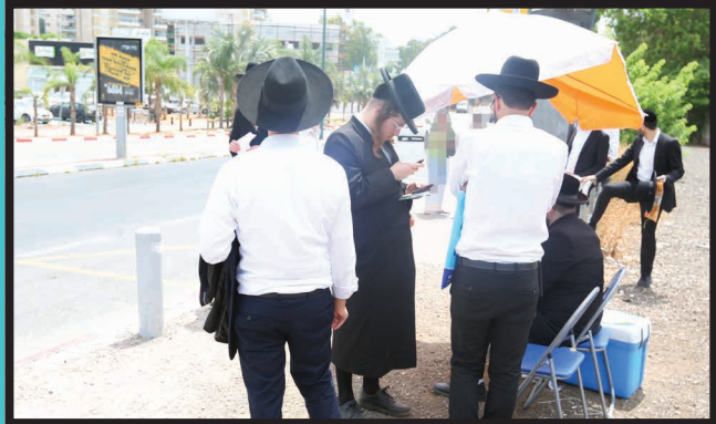
האברך מתקשר לצוות המומחים של מטה ההסברה

בדיקה מדוקדקת אם הממונים על הענקת טופס הדיחוי לא הטעו במכוון