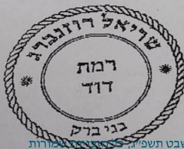
שיל"ת הר-אל מערכות, שבט תשפ"ג, כ"ח חשוון תשפ"ד

ה"ט זאג אסר כגאון התבונה השלומט ז' שאל יוסף למה של"א ע' יצחק יעדב ויבדקו יובין של"א אשור המל"ה שנינו ה"ז שגא שאלה ה"ח שיה' והזל"כ לבאר שאין חשש להשגש במל"ה זו בשב"ר קדש, זמט לכוונת אם ה"ה ה"חל והסביר לי זאג דקר' ה"סיכ' ג. ואלומס בדיוקו, כ"כ ברק ה"זו רב"ב ה"זי המלומט ג"ל שאל להשגש ה"מל"ה שגב, אלף א"ח אין ה"ה חשש א"ס"ר ב"ל. אין בקלותו ש"ק מקי"ן להשגש במל"ה שגב, ה"קא ש' ל"מס להקפ"ד להשגש במל"ה זו ב"קא, כ' במל"ה ה"חל"ה ל"א גומ"ר ה"זי. ו"ל' ה"חל"ה ל"ח"ה ו"חל"ה