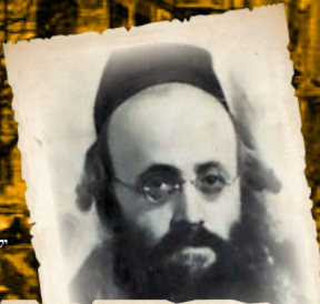
י"ד סלק' יושע אייבין

איך בין ארויס פון די אש פארלירן קוראזש א וועלט פארשוואונדן, ווי קען איך אנגיין