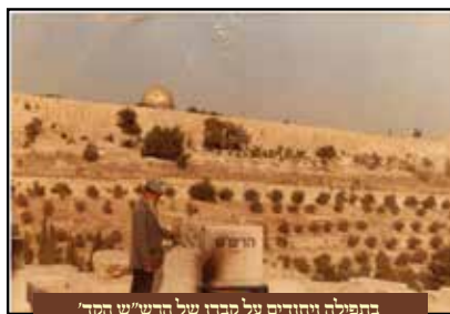
בתפילה ויהודים על קברו של ה"ש הקד"