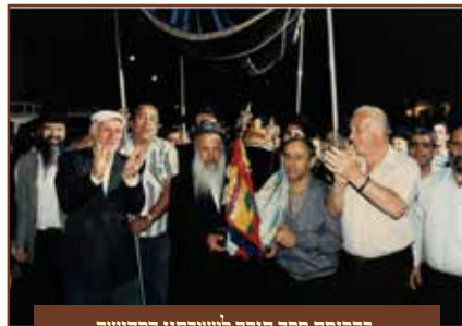
בהנכסת ספר תורה לישיבתנו הקדושה

ורק אח"כ ירד לסעוד סעודה שניה בביתו. כאן נציין שמו"ר המשיך כך ממש עד שנותיו האחרונות, ואף בעשרים שנה האחרונות שהונהג בישיבה לעשות קידוש ומזונות, הוא לבדו נשאר