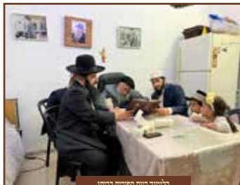
מלימודי גמרא ופירושים בביתו