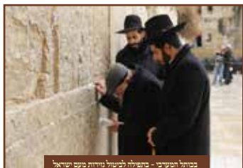
בביתו המשיב - בתפילה לעשור נידות בעש שיהאל