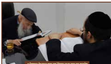
מלימוד עם נבדו ראש העיר דני וסוף שמואל שבידל"א