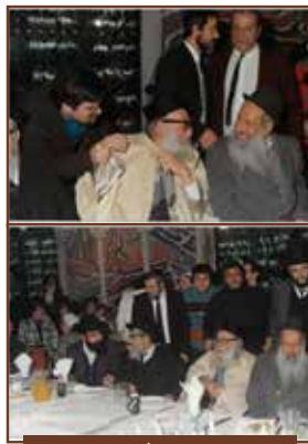
עם מו"ד הגאון המקובל רבי דוד כהן זיע"א

אשר רבים מגדולי הדור הגיעו לביתו להסתודד עימו בסוד שיח שרפי קודש, וכן ראתה את הישועות הרבים שפעל מברכותיו, היא התחרטה על כך שמנעה ממנו לעשות את רצונו הקדוש.