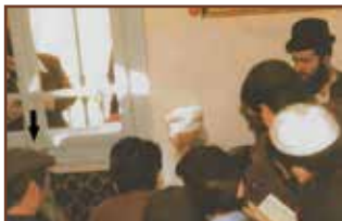
ראשון משמואל מו"ר שלימוד עם המקובל הדב מרדכי שרעבי זיע"א

מכל גדולי וקדושי תלמידיו, בחר מורן רבינו מרדכי זלה"ה למנות לראש הישיבה עוד בחייו את רבינו שלום, לפי שהערך מאוד את נקיות נפשו ומעלת נשמתו העצומה. והיה מכנה אותו "כתר הישיבה".