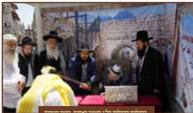
בחולותיו החולקת ב"ג בעומר אחרון במועד חגיגי