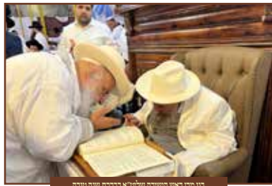
בני דוד ראש התיבה שלמ"א במסכת שנה טובה