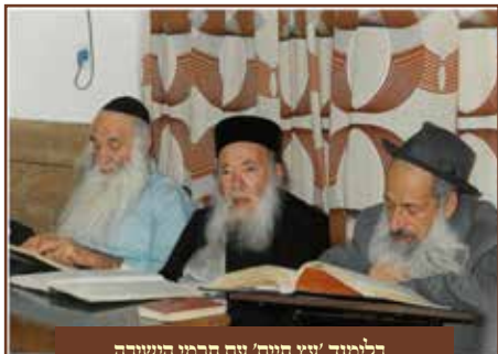
בלימוד 'עץ חיים' עם חכמי הישיבה

וללימודו, על אף הטרחה המרובה וביטול התורה שהיה נגרם לו כאשר נאלץ לשוב לביתו להערים לפני תפילת ותיקון. רבנו לא הסכים שהילדים לא יתפללו עמו, לפי שלקח אחריותם עליו, ולכן הוצרך לפקח על כל צעד ושעל ולראות עם מי מתחברים וכיצד מתפללים את תפילתם.