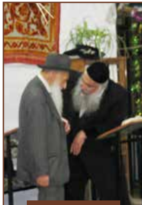
מוכס בשויה בסוד שיה