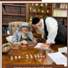
בהנחה לפירוש נפש בכוונות הרשי"ש