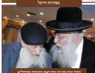
בסוד שיה עם בני סוד ראש הוישיבה שיברל"א