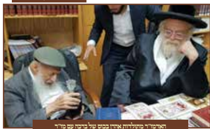
ראש מור' מנחם מור' רבי' מנחם שטר' מאמנת רבי' לויט