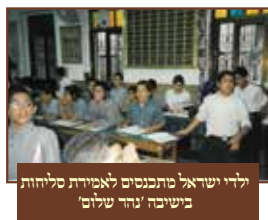
לדיי ישראל מתכנסים לאמירת סליחות בישיבה 'נהר שלום'

מספר נכדו הרה"ג שליט"א, כי בזמן שהיו הנכדים ישינים אצל הסבתא לאחר לידה וכיוצא בזה, היה רבינו מקפיד בליל שבת קודש שלא להקיצם בעת שהיה הולך למקווה