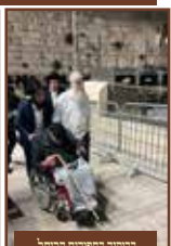
במקומו בחירותו המנוחה