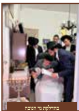
בחולותיו ב"ח טובה