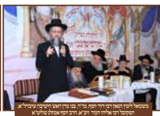
משכיל לויט שטר' רבי' מנחם המייסד, רבי' ח' שלום, מנחם מור' רבי' מנחם שטר' מאמנת רבי' לויט