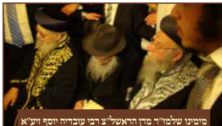
מימין שלמו"ר מרן הראש"צ רבי עובדיה יוסף זיע"א ומשמאלו הראש"צ הרב בקשי דודון זיע"א

תמיד היה רגיל על לשונו מפשטים שנחרטו בזכרונו ושמעם מפי רבו הגדול כמוהו"ר רבנו מרדכי שרעבי זיע"א, אחד מהמשפטים שהשתמש בהם רבות "אם אין גדיים אין תיישים" כלומר אם לא נדאג לילדים לחנך אותם בדרך נכונה איך יהיו תיישים כשיגדלו מהיכן ידעו כיצד לעשות ולהתחנך, זה