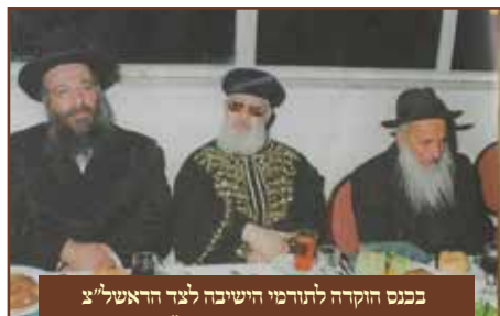
בכנס הוקדה לתורמי הישיבה לצד הראשון"צ הרב עובדיה יוסף זע"א

למספר אברכים שיהיה להם לצורכי שבת, מנהג קבוע היה לו כאשר הגיע בנו או נכדיו לסעודות שבת או לביקור בחגים ומועד בביתו, ביציאתם היה מלווה אותם כברת דרך בשתיקה כדרכו, ופעמים בהמשך דברים לדברים שנאמרו בסעודה.