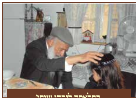
בחלאקה לנכדו שיחי'

בכל עת ובכל שעה, היה מייחד יחודים כפי שכתב רבינו האריז"ל בספרו שער רוח הקודש, כשכל מכיריו רואים בכל עת את עיניו ומצחו מתאמצים תדיר בכך. וידוע שהרמח"ל כתב לידידו רבי בנימין הכהן (הרב"ך, בספר "ירימ משה" מכת"י), כי הטעם שזכה לקבל גילויים עצומים ממלאכי מעלה, הוא מחמת שבכל רבע שעה היה עושה ייחוד... והאר"י כותב בספרו שער רוח הקודש (דף מה:), כי מעלת הייחודים היא המעולה שבכל