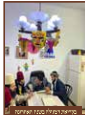
במקומו המנוחה בשנה האחרונה