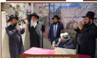
בשירה ודקדוק ב"ג בעומר לבדו הרשי"ש