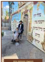
מציאתו בשמחת נבדו