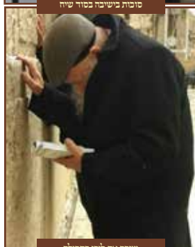
שופר את ליבו בתפילה