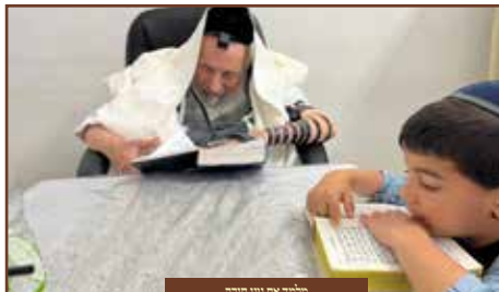
מלימוד את נטח תורה