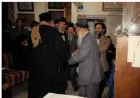
בדיקוד של מצוה עם חכמי הישיבה

בתפילותיו על הפרט, על הסטנדר העשוי שיש שניצב במקומו הקבוע לתפילת העמידה, היו מונחים באופן קבוע דפים, אשר עליהם היו באים אנשים שונים ורושמים את בקשותיהם לתפילה, אם על זיווג או רפואה וכו'. והרב היה מתפלל עליהם.