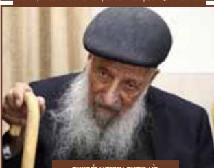
לא מחזיק טיבוחא לנפשיה