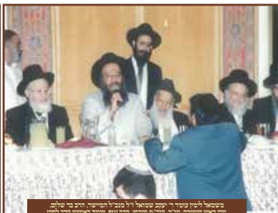
משכיל לויט שטר' ר' יצחק שמואל ר'ל מנחם המייסד, רבי ח' שלום, מור ראש התיבה מור' רבי' מור' רבי' מנחם שטר' מאמנת רבי' לויט