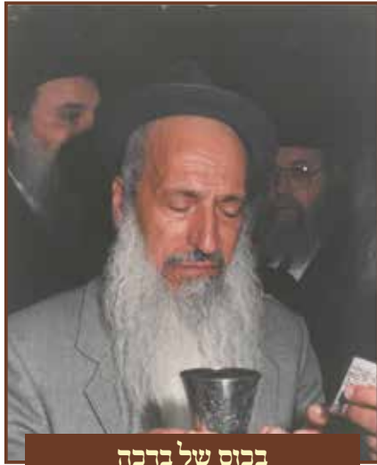
בכוס של ברכה