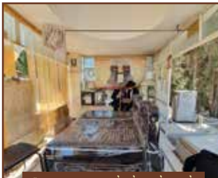
על קבוץ של המקובל האלקי וזרם סודי שרעב וזי"א