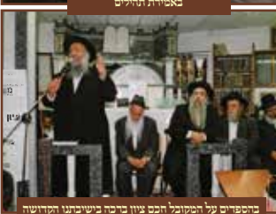
בחספדים על המקובל חכם ציון בריבא בשיבתנו הקדושה