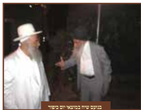
במסגרת שיתוף במועדי חג שמירה