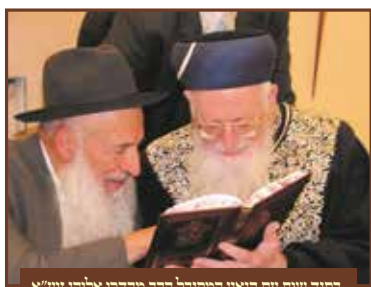
בסוד שיח עם הנאמן המקובל הרב מרדכי אליהו זע"א

נשיא מועצת חכמי התורה, מרן חכם רבי שלום כהן זצ"ל, התבטא כמה פעמים על קדושתו של רבינו ואמר, כי זכה הדור שרבי שלום שרוי בו. פעם, באחת ההתונות של נכדי רבינו, הגיע מרן ראש הישיבה חכם שלום כהן וביקש לקחת את רבינו למעגל הריקודים בכדי לכבדו, אך רבינו לא הסכים לכך בשום פנים ואופן, עד שראש הישיבה הבין כי זהו רצונו וכבודו, שכן היה משתדל כל ימיו להיות ספון בעבודת השם, מבלי לתת לעצמו שחרור אפילו קל שבקלים, אלא רק להתרכז בעבודתו ויתברך ובייחודיו של רבינו האריז"ל.