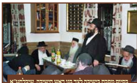
בסיום מסכת בישיבה לצד בנו ראש הישיבה שיבלחט"א