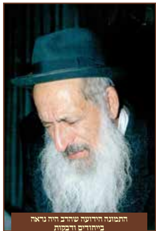
התמונה הידועה שהרב היה נראה ב"יהודים ודבקות"

ה ק ד ו ש ה להתברך מפי רבינו, בצאתו היה הולך ל א ח ו ר י ו את כל בית ה מ ד ר ש , בכדי שלא ל ה ר א ו ת את גבו לרבינו כנהוג ב מ ק ו מ ו ת קדושים.