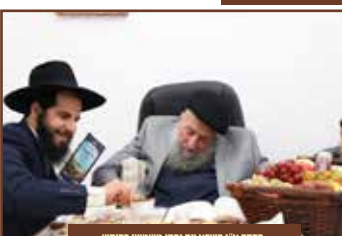
בסדר ש"ו בשבט עם נבדו מיטשטש בקורס