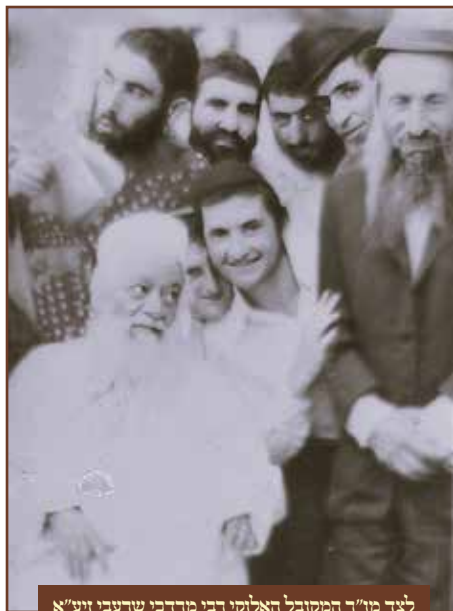
לצד מו"ר המקובל האלוקי רבי מרדכי שרעבי זצ"ל

כוונות הרש"ש כאשר לפי סודן של דברים החזרה פועלת במקום גבוה בעולמות עליונים יותר מתפילת הלחש, כאן נציין שתפילת העמידה בכוונות ארכה בין חצי שעה לארבעים דקות וכמוה גם החזרה. רבים עד היום זוכרים את השעות הארוכות שהיה עומד על רגליו ובשלב מסוים כנראה כדי להתעורר ושלל יתפסו הרגליים היה רוקע ברגליו על הארץ.