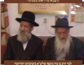
לד' רבי' בן צ'ון מנחם שטר' א' בשיבתו הקדושה