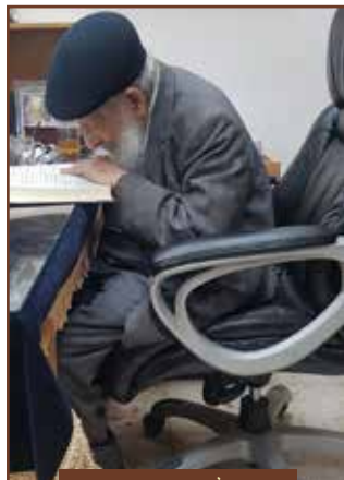
בליטור חזוהר בקדוש