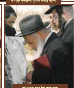
ביוחדים על קבר הדי"ש