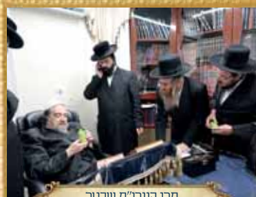
מרן הגר"מ שכטר