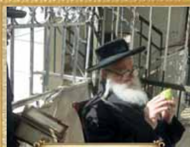
האדמו"ר ממשכנת הרועים