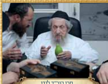
מרן הגר"ד לנדו

מרן ורבנן גדולי וצדיקי הדור בבדיקת ד' מינים בערב חג הסוכות תשפ"ג