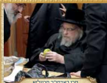
מרן האדמו"ר מבעלא