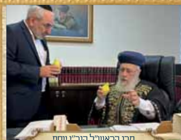
מרן הראש"ל הגר"י יוסף