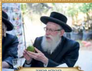
הגר"ח א' פריינד