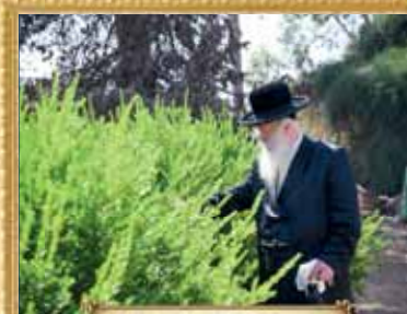
מרן פוסק הדור הגר"מ שטרנבוך