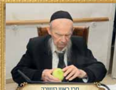
מרן ראש הישיבה הגר"ג אדלשטיין