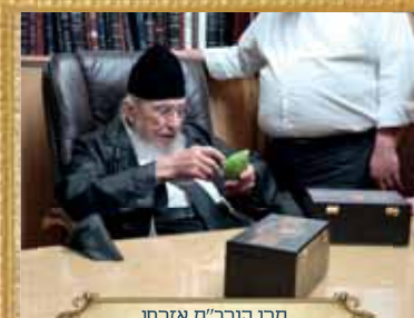
מרן הגר"מ אזרחי