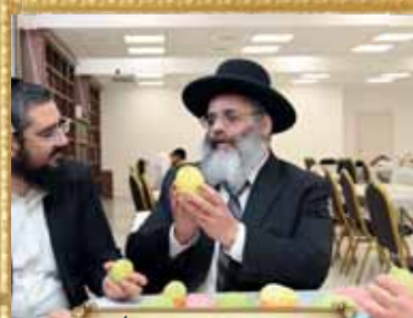
האדמו"ר הגר"י אברגל