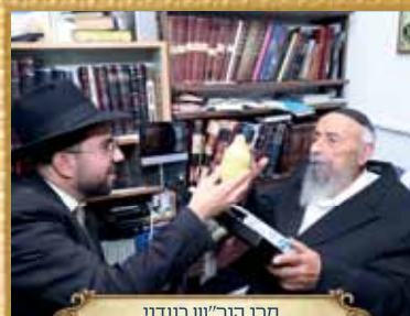
מרן הגר"ש בעדני