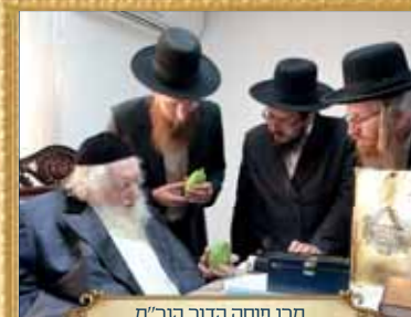
מרן פוסק הדור הגר"מ שטרנבוך