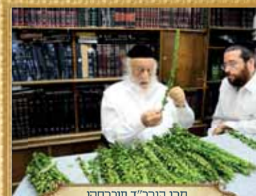
מרן הגר"ד פוברסקי