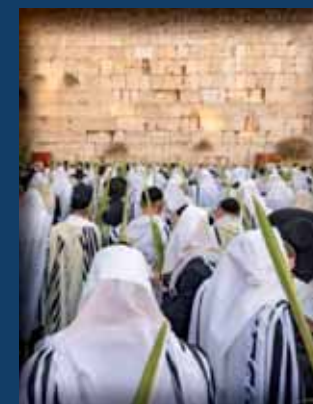
בשער הכותל המערבי בחג הסוכות

המגזין היחיד שמופץ חינם באלפי עותקים בבתי כנסת שטיבל ומקוואות בכל המגזר החרדי ברחבי הארץ!