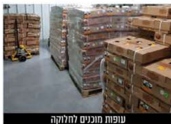
עופות מוכנים לחלוקה

השנה, מציינים בממלכת החדש של השרון 'קופת העיר נתניה' כי ניכרת עליה משמעותית במספר הנרשמים לימי התנדבות. השנה גם רואים הורים שמגיעים יחד עם ילדיהם לחלוקת מזון למשפחות, כל רכב לוקח חבילות מזון