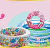
מחבר גדול של גלגלי ים ובריכות