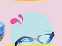
חשקפות שחיה עם מספר