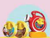
מקרנצ'יק וקלטות למקרנצ'יק