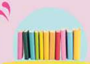
ספרי קריאה וספרי לימוד