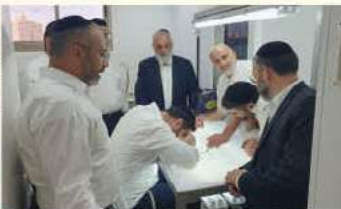
רבני ומפקחי מערכת הכשרות בהשתלחות בנושא החוקים במזון