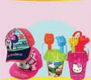
כובעי שמש ואביזרים לים