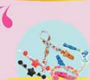
מחבר גדול וחדש של מחזיקי חוצצים