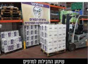
שיעור החבילות למדפים