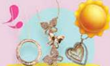
שרשראות ועגילים גולדפילד