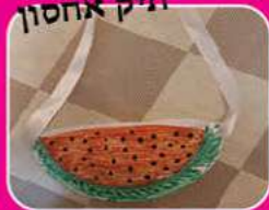
וקיבלנו תיק אחסון

הזוכה בזכות קניה בחנות ספרים טובים יעקב פנחסי