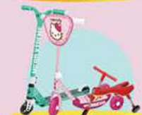
אופניים, קורקינט ובימבות