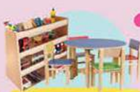
ציוד וריהוט לגנים