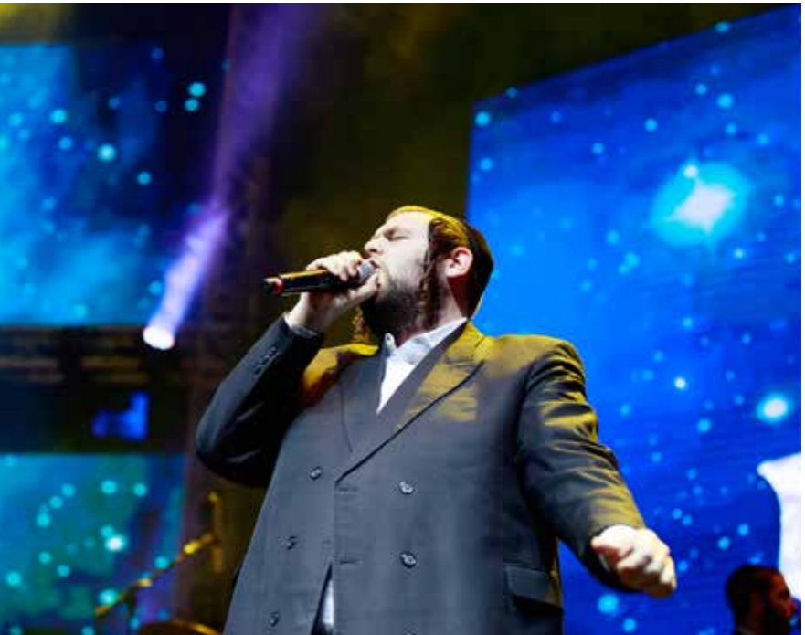
קומיץ ענק. הופעה בארנה

בעוצמה מספקת. חיפשתי את האחראי שיסדר את הענין, ואכן עובר שם אחד עם מחשב לפטופ בידו, אני לא מכיר אותו בשמו, אבל הבנתי שהוא טכנאי הסאונד ואני צועק לו "אחי, תן לי יותר מוניטור, אני צריך יותר עוצמה", והוא היה נראה קצת נבוך, "אני לא יודע לסדר את זה, אתה צריך כנראה מישור אחר", התנצל והמשיך לדרכו,