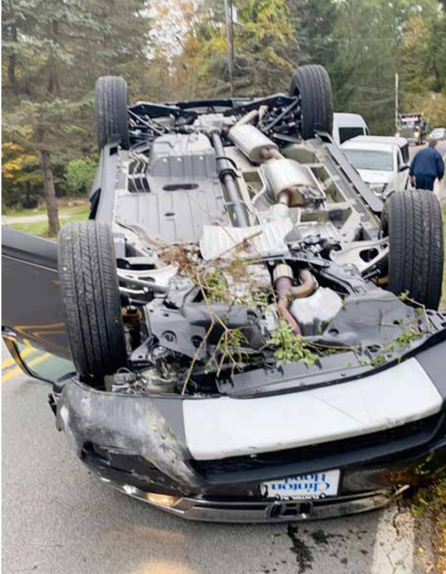
סטנו בזהירות". רכבו ההפוך של אונגר במשעולי הקטסקילס