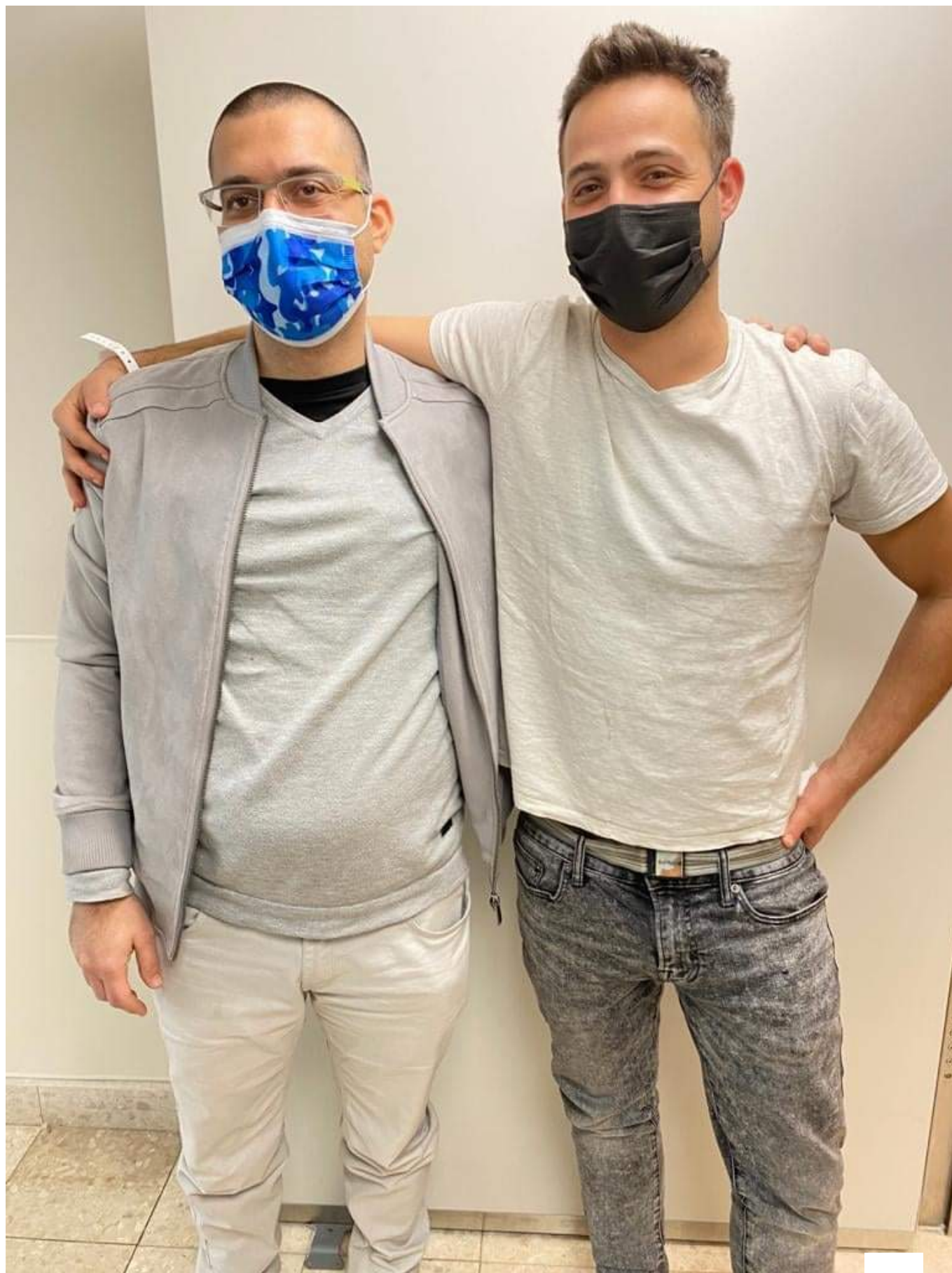
הראו ימין) עם מקבל הכליה. "קוראים לזה שותפות וערבות הדדית ועם זה מנצחים"