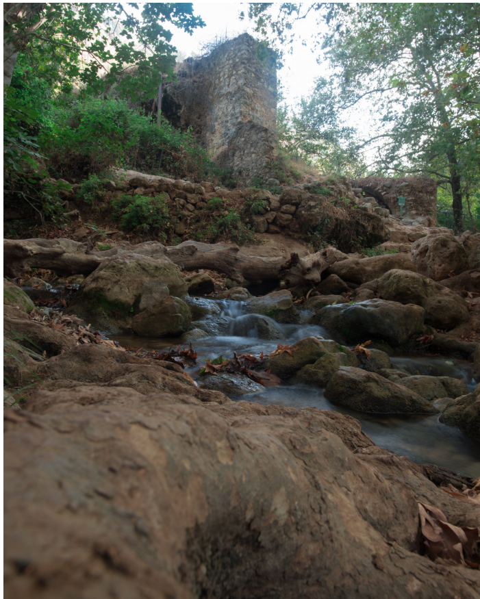
טחנת קמח בנחל עמוד

בדרכנו נפגוש במבטשה – בית מלאכה לעיבוד צמר, מלאכה שבה עסקו יהודי צפת. בדומה לטחנת הקמח, גם המבטשה עושה שימוש בכוח המים כדי להניע את כפות העץ הגדולות שחבטו בצמר, אחד משלבי ההכנה שלו.