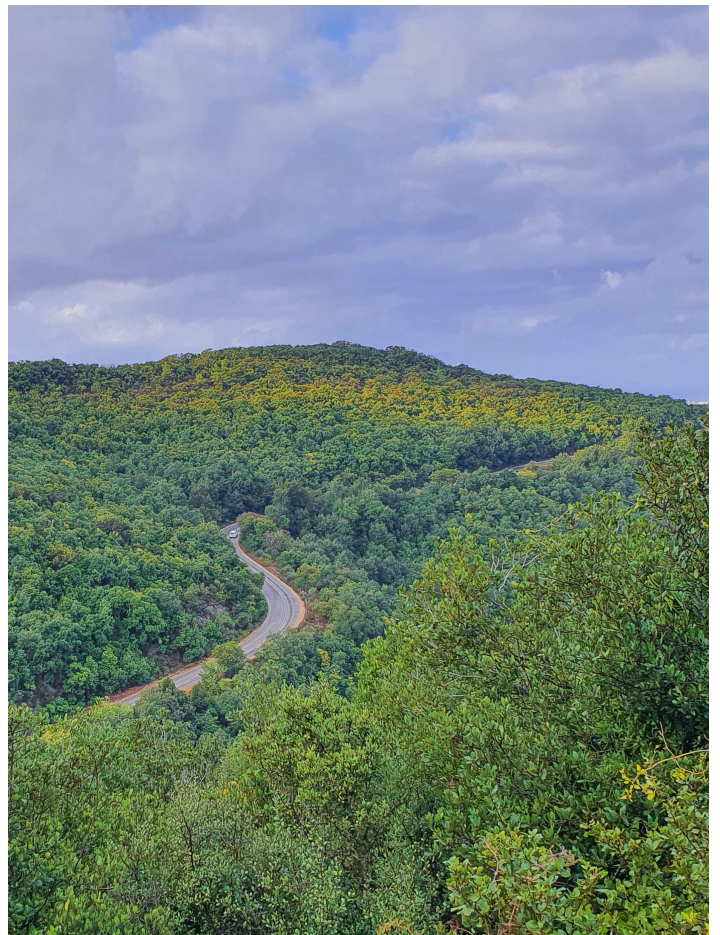
תצפית בעליה לשביל הפסגה

בשל גובהו הרב של גוש מירון, יש בו ריבוי משקעים (כאלף מ"מ ויותר), שיחד עם סלעי הגיר והדולומיט הבונים אותו, יוצרים נוף קארסטי מגוון של טרשים, בולענים, עמודי סלע, מערות ובורות עמוקים עם נטיפים. הטופוגרפיה התלולה הקשתה על התיישבות האדם באזור מקדמת דנא, ולכן קיים בו חורש ים-תיכוני מפותח ורצוף שכמעט ולא נפגע מיד אדם. בחורש תמצאו עצי אלון מצוי ואלון תולע, שזיף הדב, אגס סורי וכן ערער ארזי וחוזר החורש, שזהו בית גידולם היחיד בארץ. מגוון הפרחים כאן עשיר במיוחד וכולל מספר מינים נדירים, בהם רקפת יוונית, אדמונית החורש ומיני סחלבים. בחורף הפסגה מכוסה לעיתים קרובות בשלג.