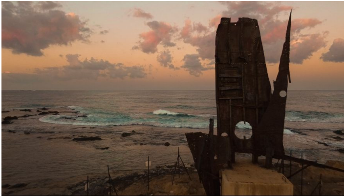
אנדרטת המעפיל חוף אכזיב | צילום: אפרת בן חמו

ממשיכים עם נחל כזיב מזרחה כ-100 מטר, עד שמגיעים לגשר מסילת הרכבת שעובר מעליו. במקום נמצאת אנדרטת יד ליי"ד .