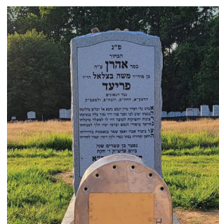
הקבר הטרי של ארי בבית החיים במאנסי