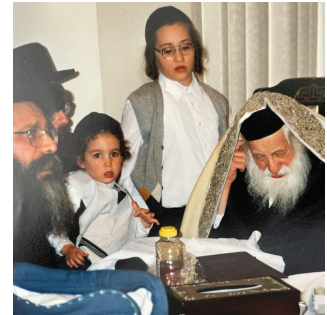
החלוקה של אהרלה אצל הרבי מסקולען זי"ע