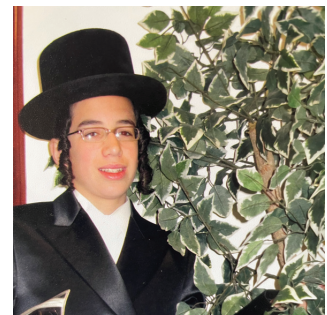
אהרלה ביום הכנסו לעול תורה ומצוות