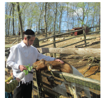
אהרלה הנשמה הטובה שכל רצונה בעולם היה לעשות רק טוב

מגנט. הברירה אל עולם חלול ששיכיח ממנו ולו לרגע את כאב העבר וקשיי ההווה, נחשבה בהרגשותו כתרופת פלא לכל מכאוביו. וכשנפל, הוא התקשה למצוא את הדרך החוצה, על אף שניסה. כמה סבל ארי באותן שנים. אבל גם אז לא יכול היה לשאת את המחש-בה שלהוריו יש צער ממנו, לכן ניסה להפוך עולמות כדי לצאת מהבור ההרסני אליו נשאב.