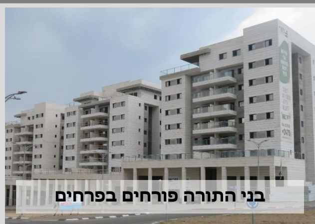
בני התורה פורחים בפרחים