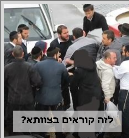
לזה קוראים בצוותא?