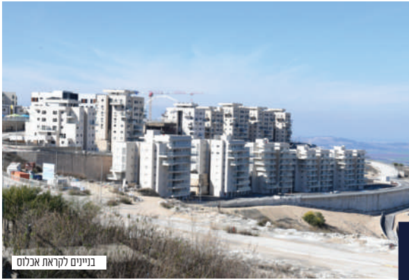
בניינים לקראת אכלוס