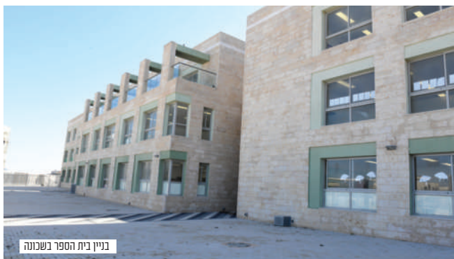
בניין בית הספר בשכונה

הרבה נשים עובדות בחינוך, אך ישנה עבודה גם במזכירות, תכנות, ותחומים נוספים, רובן של העבודות ממש בתוך העיר, והמעוניינות לעבוד מחוץ לעיר יש כמובן שלל עבודות בקרבת מקום, כשהמציאות היא שב"ה כל אשה שהחפצה לעבוד עובדת במקום שהיא מרוצה בו ומשתכרת כראוי.