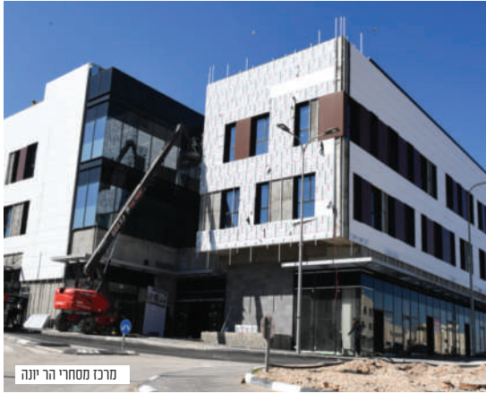
מרכז מסחרי הר יונה