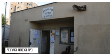
בית הכנסת המרכזי