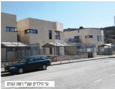
גני הילדים שע"י רשת הגנים