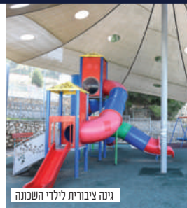
גינה ציבורית לילדי השכונה