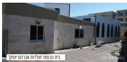
בית הכנסת 'תולדות אברהם יצחק'