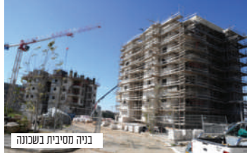
בניה מסיבית בשכונה