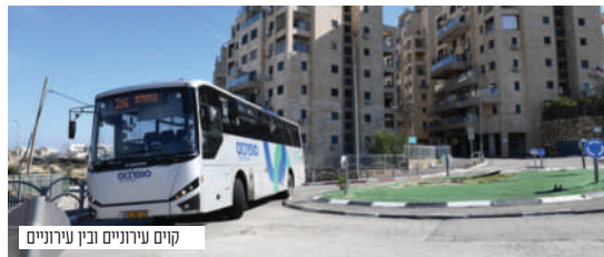
קוים עירוניים ובין עירוניים

יש מהר יונה תחבורה ישירה לערים בני ברק, ירושלים, צפת, מירון, וערי המרכז, כאשר בקרוב מתוכננת תחבורה ישירה גם לקריית ספר ובית שמש ואשדוד.