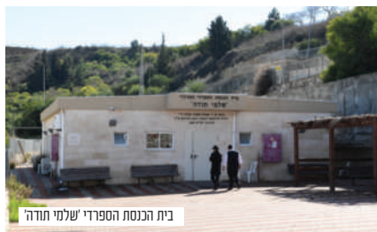
בית הכנסת הספרדי 'שלמי תודה'