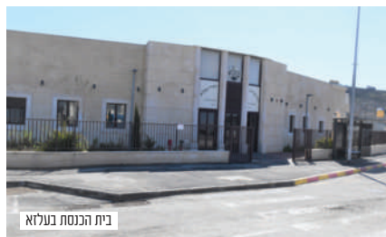
בית הכנסת בעלזא