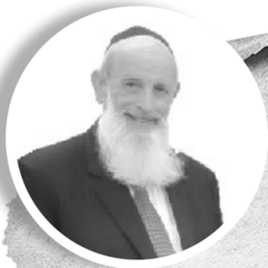
בס"ד ח' אדר תש"פ