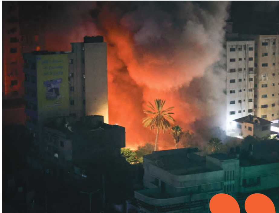
משיבים אש. ממראות ההפגזה בעזה

גם על העיר נתיבות הסמוכה לעוטף עזה לא פסחה המפלצת החמאסית. חני כהן, גדלה בנתיבות וכיום תושבת המרכז, התארכה בשמחת תורה אצל משפחתה בעיר המקובלים של הדרום. תוך דאגה לחלק ממשפחתה שנותרה בנתיבות