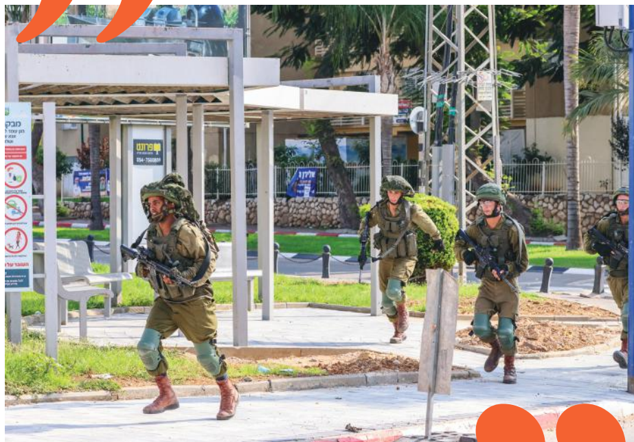
נלחמים על הבית. הכוחות סורקים את השטח