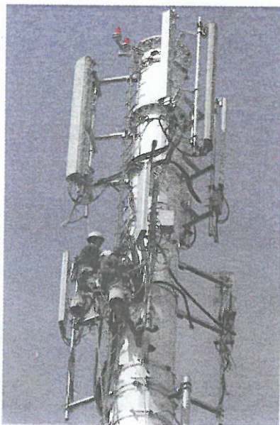
אנטנות סלולאריות

אשרינו מה טוב חלקנו ומה נעים גורלנו! ברוך המקום שמשו עולמו 'שומרים'!