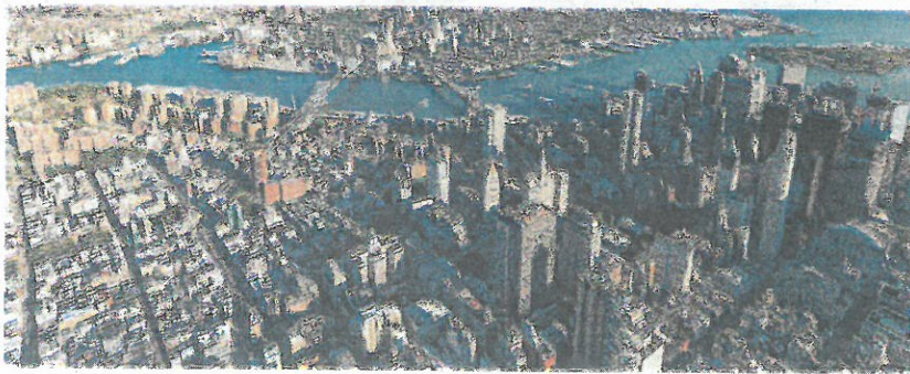
האיסט סייד באמריקה כיום. התובנה העמוקה של מרן פוסה"ר רבי משה פיינשטיין ז"ל: לעמוד בניסיונות בשמחה...

ה'זום' הוא המיסיונר של האינטרנט. הוא לא מציע גלישה, חלילה. לגמרי לא. הוא רק מציע שיעור תורה ברבים. מה יותר טוב מלראות את המגיד שיעור הנערך, בדיוק כמו בבית המדרש, או לשבת מול החברותא ולהסתכל בפניו מרחוק מקום ובקירוב הלבבות. אבל זו בדיוק המטרה. כאשר השיעור תורה יסתיים וייעלם מהמסך, או אז יציפו אותו "מפגשים חברתיים", "מסיבות קבוצתיות" ומשם – הדרך לשאל תחיתות קצרה.