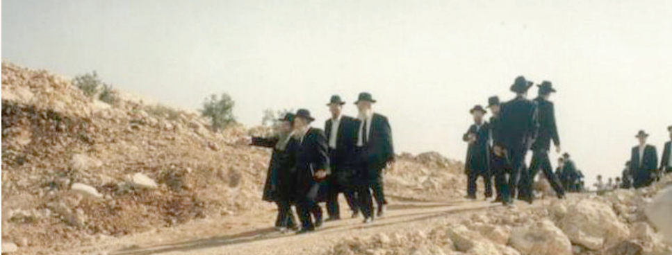
ראש הישיבה הגאון רבי אהרן יהודה לייב שטינמן זצ"ל בשנת תשנ"ו, מתהלך בשבילי עפר החולות של העיר העתיקת מודיעין עילית עם תלמידו, המרא דאתרא הראשון הגאון רבי שמחה קסלר זצ"ל, ובחזונו מצביע על העיר החרדית השלישית העומדת להיבנות

"ואתו הדבר גם בכוללים. גם בכוללים לומדים