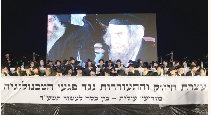
ראש הישיבה זצ”ל במשאו הנלהב בעצרת ההיסטורי בפארק העירוני לחיוזק והתעוררות נגד פגעי הטכנולוגיה בעיר מודיעין עילית, שהתקיים בין כסה לעשור תשע”ד, בהשתתפות אלפים מתושבי העיר שזעקו ‘נעשה ונשמע’ להוראות גדולי ישראל