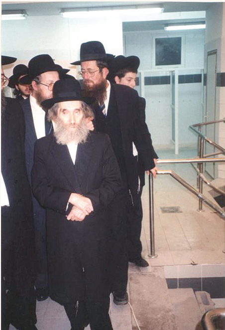
ראש הישיבה זצ”ל בסיור ובדיקת המקוה הראשון שנבנה בעיר מודיעין עילית לפני שני עשורים, אז שכנת ‘קרית ספר’

דלינו קמענים מאלפים מאשר השמייע ראש הישיבה זצ”ל לר”מים ומחנכים אודות הלימוד עם התלמידים, חלק מקמענים אלו נתפרסמו בשעתם