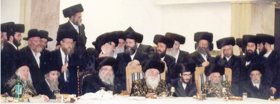
ראש הישיבה זצ"ל בשמחת בית צדיקים, נראים מימין לשמאל: כ"ק מרן אדמו"ר מסערט ויז'ניץ שליט"א; אביו כ"ק מרן אדמו"ר הי"חכמת אליעזר' זצ"ל; החתן: כ"ק מרן אדמו"ר הי"שועות משה' מוויז'ניץ זצ"ל; יבדל"ח כ"ק מרן אדמו"ר מבעלזא שליט"א; מרן ראש הישיבה הגראי"ל זצ"ל ויבדל"ח כ"ק מרן אדמו"ר מקאליב שליט"א

וסיפר עוד ראש הישיבה זצ"ל: שבימים בהם הרביין תורה בכפר סבא, נסע פעם לבית הרבי מבעלזא זי"ע בתל אביב, היה זה במוצאי שבת קודש, והגיע מאוחר בלילה, ועדיין אחו הרבי מבעלזא באמצע סעודה שלישית, ונעמד לראות בעבודתו בעת עריכת שולחנו הטהור, וראהו בולע מזונו מבלי ללעוס, כדי שלא ליהנות מהמאכלים. (הדברים נדפסו ונתפרסמו בחיי ראש הישיבה זצ"ל בגליוני 'כאיל תערוג').