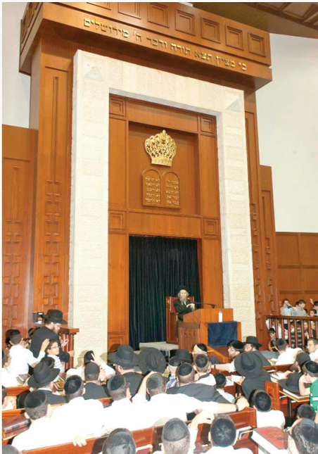
ראש הישיבה זצ"ל בשיחת מוסר בישיבת מיר ברכפלד במוזיז'עין עילית

"ומי שבעניני בין אדם לחבירו מתנהג כראוי, אזי מלבד זאת שכולם יהיו מרוצים ממנו, הוא עצמו יהיה מרוצה ממהלך חייו שיוכל לעבוד את בוראו בנחת וברגיעה, וכפי שאמרו חז"ל (אבות פ"ג מ"י) 'כל שרוח הבריות נוחה הימנו רוח המקום נוחה הימנו', יוצא שאם בן אדם נוהג כראוי ברוח הבריות, דהיינו שבין אדם לחבירו הוא בסדר, אזי רוח המקום נוחה הימנו, ובודאי יוכל לבוא לידי עבודת ה' אמיתית כי כל זמן שאדם הוא עם מדות רעות אי אפשר לו להיות עובד ה' אמיתי. שהמפתח לבוא ללב טהור, צריך להתחיל בדברים בין אדם לחבירו, ומי שבין אדם לחבירו הוא לא נקי, אז בין אדם למקום הוא ג"כ לא בסדר, כי אי אפשר להיות עובד ה' אמיתי אם הלב לא בסדר".