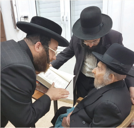
בביקור במעונו של ראש הישיבה זצ"ל בערב ראש השנה האחרון

ראש הישיבה זצ"ל סיפר, שבתחילת לימודו עם בחורים היה מעיר ומעמיד בחורים על מקומם. פעם אחת העיר בחזקה לבחור אחד, הלה נפגע מאוד ונשבר. לאחר כמה שנים התחתן ורח"ל