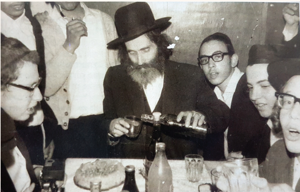
ראש הישיבה זצוק"ל עם תלמידים צעירים. לטעת בקרבם תורה ויראת שמים

ראש הישיבה זצ"ל סיפר על השכנות עם הרב מבריסק, שהתגורר ברחוב 'ליסטובסקה'. בית