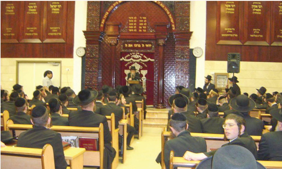
ראש הישיבה זצ"ל בשיחת מוסר בהיכל הישיבה גדולה 'בית אהרן וישראל' דחסידי קארלין סטאלין בירושלים