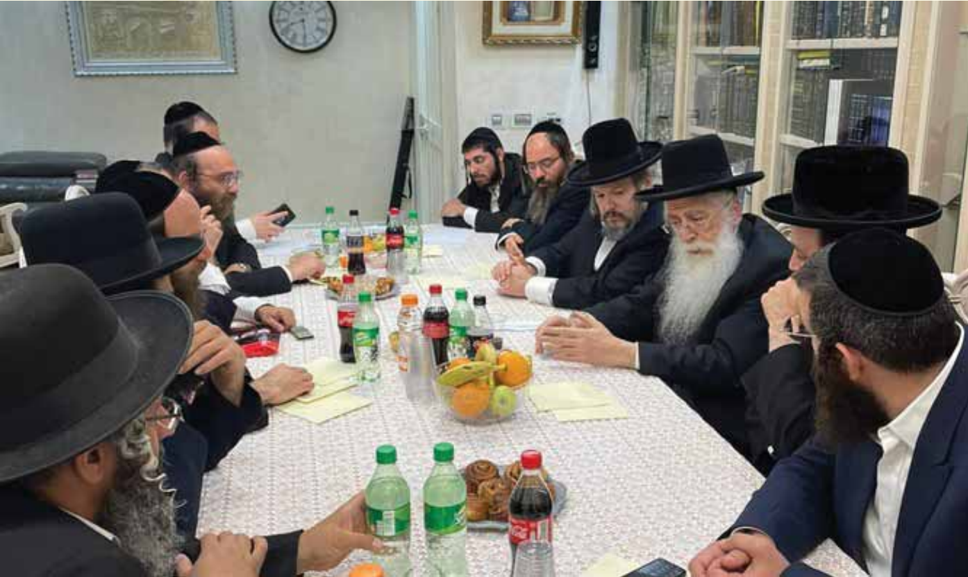
סגן השר הרב מאיר פרוש בכינוס גבאי בתי הכנסת 'ברסלב' בביתר עילית

נותנים לדבר כזה ליפול בין הכסאות. אנחנו נדרוש שהממשלה תדאג להכין תכנית, להתמודד עם כל הנושא הזה ששמו אומן - היא חייבת לדעת שחייבים לחיות עם זה.