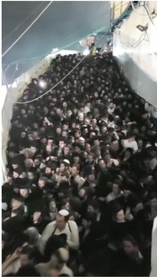
רגע האסון — הדוחק הקטלני...

עמדתי בין החיים ובין המתים באותו מקום, הוא פותח. בעקבות היותי