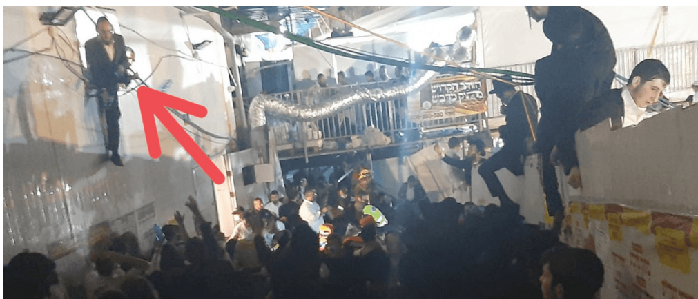
'יהודים סיכנו את חייהם בשביל להציל חיי אחרים'. ר' יואל שלזינגר על מפתן חלון חדר הכנסת אורחים