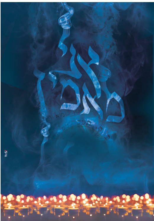
אור האמונה על רקע האסון במירון

'אין מה לעשות', אומר אז השוכב על ידי. מימיני ומשמאלי קוראים יהודים בזעקות שמע ישראל ומשתדלים להכין עצמם לעלות לעולם שכולו טוב, ואני בתוך הגולה