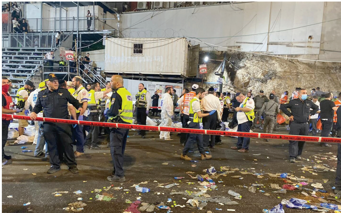
כוחות הצלה בשטח. מראות קשים מחד, ונסים גלויים של ניצולים בד בבד

בחור נוסף היה שם, אשר תכנן לעזוב את המקום לאחר ההדלקה בתחילת הריקודים, אך בשעת מעשה נזכר כי