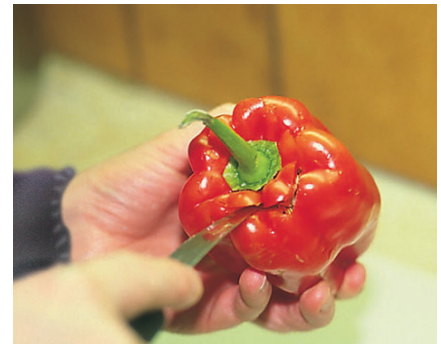
מסירים את חלקו העליון של הפלפל או חוצים את הפלפל לאורכו