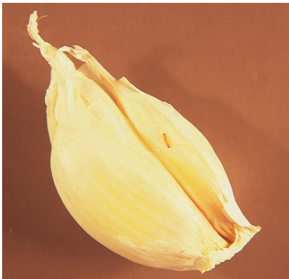
זחל עש בין שיני שום