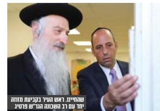
שהחליטו. ראש העיר בקביעת מחזה יחד עם רב השכונה הגרש פריטי

חזרה לנושא הזה שליווה אותנו לפני חמש שנים, בעקבות הידיעה השקטה שקיבלנו השבוע משכונת בר אילן, ולפיה מבנה הגנים בשכונה שעמד שומם מחוסר תלמידים, הועבר השנה לגני הקהילה החרדית בשכונה, וביום הראשון ללימודים ילדי השכונה החרדים יוכלו סוף סוף ללמוד בגנים שלידי ביתם ולא לגלות בתגליה כפיה כפי שגורשו אילי שכונת חור הובב של העירייה שהתהורה בתואר 'חטוב המשותף', אבל מאוחר יותר הוכתרה זה היה נראה אחרת.