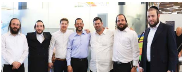
משכנתה ראשונה או משכנתה פניונית ואף מתמחה במשכנתאות לתושבי חוץ, המעניינים לרכוש דירה בארץ.

מוצר ייחודי נוסף מהמסומחים של ספנות הוא "משכנתה בקצב הזו"צ", מסלול המאפשר לזוג הצעיר לקבוע מראש את גובה ההחרגה החודשית ולהתאים אותו לפי היכולת. זהו מסלול משיש, בו ניתן גם לשנות את גובה ההחרגה החודשית בהתאם להכנסות או להוצאות הצפויות. כך