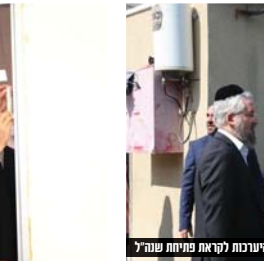
בסיר ביערכות לקראת פתיחת שנה"ל

במתחם גני הילדים ברחוב עובדיה הנביא נשמעו ייסורים כי תוחם, במתחם "הבד" בשכונת רמה ה' שם ייסורו שורה של כיתות לשלל מוסדות לימוד, בהמשך הגיעו למתחם החדש ברחוב רב המנוגד ברימה ה' גם שם ייסורו עשרות כיתות, במתחם מעונות היום בשכונת רמת אברהם וסימו במתחם מיון האשפה עם ססר ראש העיר