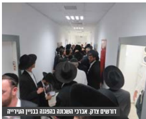
דורשים צדק. אברכי השכונה בהפגנה בבניין העירייה