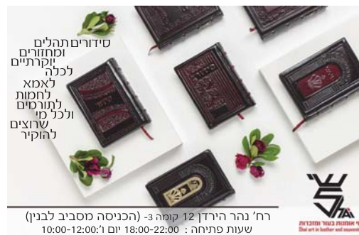
רח' נהר הירדן 12 קומה 3 - (הכניסה מסביב לבניין) שעות פתיחה: 18:00-22:00 יום 10:00-12:00

למרות החשש שהוכרז לגבי תל אביב, בבית שמש לכאורה זה לא יקרה, שכן ישנן הסכמות שונות שיוכלו לבחירת רב עיר בית שמש אחר