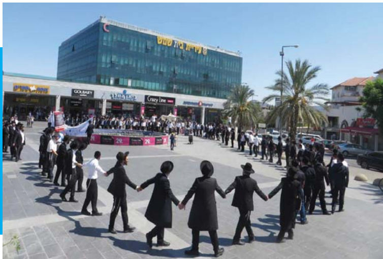
ילדים יפה גן. מחרוזת הפנת הור בר אילן - לפני 9 שנים

ווחיקי העיר שזוכרים את המאבקים שהתנהלו מול הזכות של משפחות אברכים שכונת בר אילן לגני ילדים משפשיים השבוע את עיניהם מול השלט 'גני הקהילה' המתנשא על גני הילדים בשכונה שהתרוקנו מתלמידיהם, ורק עם חילופי השלטון בעירייה יוכלו סוף סוף השבוע לחלצם משיממונם ולהעבירם לשימוש ילדי השכונה למרות שהם חרדים / באתי לגני