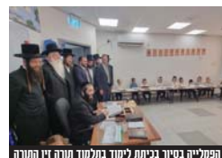
הפעליה בסיוור בכניסה למחזור תורה זיו התורה