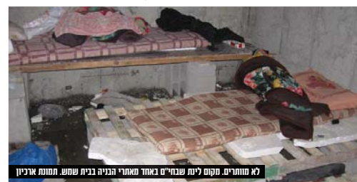
לא חתומים. מקום לינה שבחיים באחד מאתרי הבניה בבית שמש. תמונת ארכיון

בהמשך הבוקר, בפעילות שוטרי תחנת מוריה ממרחב ציון, השוטרים שמו לב לרכב שביצע פניית פרסה מיד שהבחין בשוטרים שרדפו אחריו עד שנעצר לא הרחק מהמקום. בבדיקה נמצא כי שני הנוסעים הם שוהים בלתי חוקיים תושבי י"ש בשנות ה-30 וה-40 לחייהם. נהג הרכב החשוד בהסעת שוהה בלתי חוקי, הנו תושב ירושלים בן 49. שלושת החשודים הועברו לחקירה.