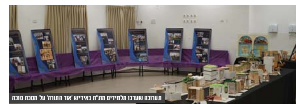
המרכז שפר שוכן לתלמידים מ"ת באידיש 'אור התורה' על מסכת סוכה

את התחנה הראשונה אגנטו עושים במרכז שפר שנמצא בפאתי שכונת יפה נוף בעיר, המוסד הראשון שהוקם ע"י אהל בבית שמש. הבניין גדול וממוכד, אך מי שנכנס לשם לא יכול שלא לצאת עם המשפט 'מועט המחזיק את המרובה', שכן למרות שמדובר בבניין בן כמה קומות, הוא מנוצל לא רק ב-100% אלא הרבה יותר, ונדמה כי בן מטר בבניין מיועד בכדי לתת את התקווה