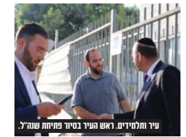
עיר ותלמידים. ראש העיר בסיור פתחת שנה.

שנת הלימודים החדשה נפתחה השבוע, אבל שימו לנתון המעניין שהתפרסם השבוע ולפיו בית שמש במקום השני בארץ בעיר בה החלו ילדים ממשפחות עולים את שנת הלימודים, ומדובר במספר מרשים ביותר המלמד כי בית שמש ממשיכה להיות עיר אטרקטיבית לעולים חדשים מהעולם ההודי.