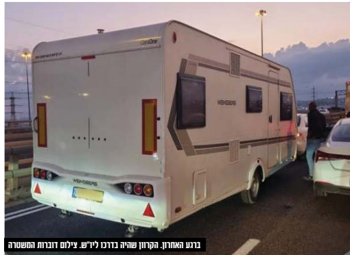
ברגע האחרון, הקראון שהיה בדרכו לירושלם צולם בזרזות המשטרה

מדוברות המשטרה נמסר: "משטרת ישראל ומחוז ירושלים בפרט, תמשיך לפעול כל העת לטימור עבירות הרכוש, איתורם של מעורבים בכך גם כאשר פועלים במקומות מרוחקים ומצוי הדין עמם, זאת במטרה להגביר את תחושת הביטחון בקרב הציבור בכל מקום ברחבי הארץ והגנה על רכושו".