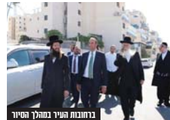
ברונות חניב במהלך הסיוור