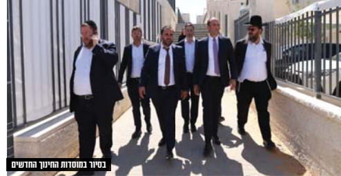
בסיר במסגרת החינוך החדשים

עיריית בית שמש השלימה מבצע חירום להקמת 200 כיתות לימוד חדשות | תוך שנה: גידול של למעלה מ-10% בכמות התלמידים בבית שמש עם 52,935 תלמידים ותקציב שנתי של 450 מיליון ש"ח | ראש העיר הרב שמואל גרינברג: "השקענו השנה תקציבים חסרי תקדים בפתיחת שנת הלימודים, בית שמש שמה את החינוך בראש"