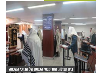
בית תפילה אחד מבתי הכנסת של אגודת השכונה

8000 נפש לא אף מנגה לבית כנסת, וללא גני ילדים, העירייה בחרה להתעלם מאומנו ומורכבו. בשנת 2017 החלטו בהליך הקצאה מסודר מול העירייה על הקרקע האחרונה שנותרה בשכונה ונדרשו בטענות הנדסיות. "ענת התפנה שטח גדול ובכונת העירייה לתת אותו ללא דין לגופים שלא בהכרח הולמים את השכונה, פועלים כחוק, ובדואי שמדובר בהקצאה לא שוויוניות ופרופורציונלית, אשר על כן אנו מבקשים לקבל את ההקדק לנכריות."