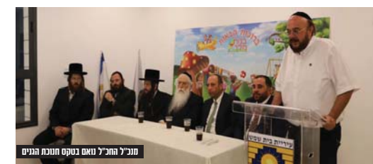
מנכ"ל החב"ל נואם בטקס חנוכת הגנים