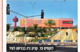
מוקדם צהריים: קניון ביי בנגינה לעיר