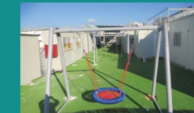
בית הספר לבנות באידיש שירת אסתר