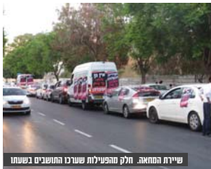
שיירת המחאה. חלק מהפעילות שערך התושבים בשעתו

לכאורה יבואו כאלו שלא מכירים את השכונה ושאלו מה השמחה הגדולה, - עומדים מבנים עירוניים ריקים ומדוע לא לתת אותם עבור גני ילדים של ילדי הקהילה החרדית הסובבת? שאלה שבאמת אין לנו תשובה להשיב עליה, אלא רק לומר "ברוכים הבאים לשכונת בר אילן..."