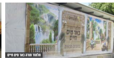
תלמוד תורה באר מים חיים

שעברו השנה במיוחד לבית שמש בכדי לתת לילדיהם את המענה המקצועי של שפר. לצד הגנים גם פועל בית ספר שיקומי ברמה גבוהה, בית ספר שנותן את כל המעטפת לתלמידים ומלווה כמובן עם אנשי מקצוע ורופאים בעלי שם. בית הספר מתרחב והולך, וגם השנה נפתחו כיתות חדשות וישנן גם כיתות מנגילות. ההשקעה של הצוות החינוכי וזכה לשבחים מרובים מכל גורמי המקצוע המלווים את בית הספר, רק הצפיפות צריכה להגיע לפתרונות מהירים, שכן לתלמידי בית הספר שפר אין את הזמן להמתין לכן.