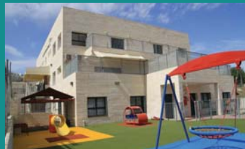
גני ילדים ותענות שיקומיים