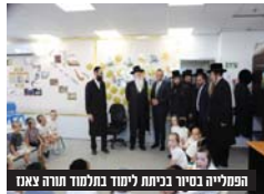
הפעליה בסיוור בכניסה למחזור תורה צאנו