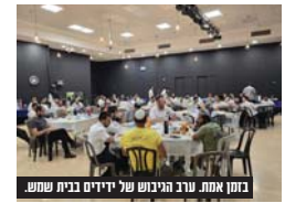
בזמן אמת. עובד הגיבול של יידיים בית שמש.

לפי הידיעה עליה חתום העיתונאי יובל בגנו, 806 עולים חדשים, שהגיעו לישראל במהלך חודשי הקיץ למרות המלחמה, יחלו השנה לראשונה את לימודיהם בארץ, מתוכם 105 בכיתה א' ו-408 ילדים ילמדו בבתי ספר יסודיים, 223 בחטיבות בנינים ו-175 בתיכון. היישובים המובילים בהם יש תלמידים עולים הם נתניה (87), בית שמש (85), חיפה (77), ירושלים (58), חדרה (44), רעננה (44) ות"א (41). מרבית התלמידים הגיעו מרוסיה (34.1%), צרפת (25.7%) וארה"ב (20.3%). המספרים מדברים בעד עצמם, ומעידים כמובן אתגר מחייב עבור שאר התלמידים לקלוט בצורה מכובדת את התלמידים החדשים שעברו מעבר לארץ חדשה יכול להיות רווי בתאגרים לא פשוטים, ובודאי כאשר ההורים החלצים לעזור זה יכול להגמיר את קשיי הקליטה, ולתת להם את היכולת להתחיל בגלג ימין.