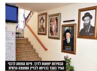
הבחירות יוצאות לדרכן. פינת המצבה לרבני העיר בעבר בכניסה לבניין המועצה הדתית

במסגרת ההסכם הקואליציוני ש"ס ניסתה לקדם בבג"ץ הצעת חוק שתוכל להגשים נהלים בבחירת רבני עיר. אך בשל מאבקים חוזרים ונשנים בתוך הקואליציה חוק הרבנים לא עלה להצבעה, ומשכן בש"ס הבינו כי אם לא עכשיו אימתי, ועל משרד הדתות לפעול בדרך הישנה ובלבד שעשרות ערים בישראל שאין בהם רב עיר מתכן ויכלו להתעטף עם רב עיר שינווט את שירותי היהדות והרבנות בעיר.