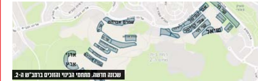
שכונה חדשה מתחמי הביני והחוכים ברמב"ש ה-2

כפי שכבר דיווחנו, 2,200 יח"ד בעיר עתידות לצאת בהגרלה הבאה של דירה בהנחה. רמ"י שיווקה בהצלחה 2,957 יחידות דיר מותוך 3,438 יחידות שהוצאו במכרז (חלק קטן יומכר בשוק