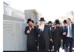
הפעליה בכניסה למחזור תורה צאנו