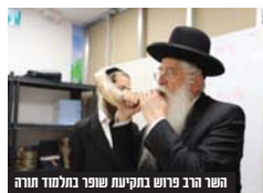
השר הרב פרוש בקביעת מזוזות