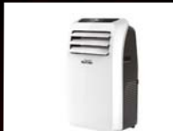
מזגן נייד SUZUKI וק- 1499 ₪