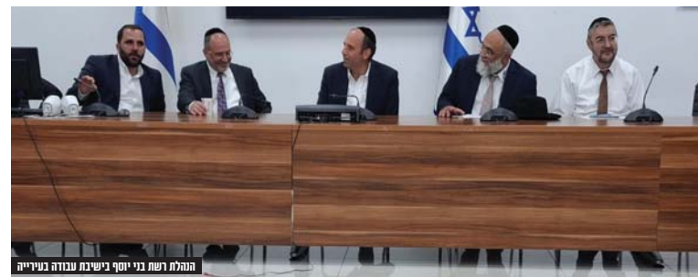
הנהלת רשות בני יוסף בישיבת עבודה בעירייה