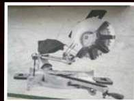
מסור פנדל 12" מולד ליין SUZUKI וק- 999 ₪