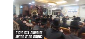
מחנה התפילה.

אח"כ נכבד לשאת דברים מנח"ל מוסדות באיאן הרב בנימין הרשל שליט"א כאשר בראשית דבריו איחל "מול טוב" לכלל המשתתפים לרגל הרחבת גבולו הקדושה ופתיחת מוסדות חינוך לתורה ולחסידות בעיר בית שמש. והוסיף לספר על התפעלותו מנחישות ציבור האברכים להקים ת"ת משלהם חרף כל הקשיים שתקלו בדרך והו גרם גם לו להנהגת המוסדות לקחת חלק מההצלחה ולהטות שכס בכל המצטרך.