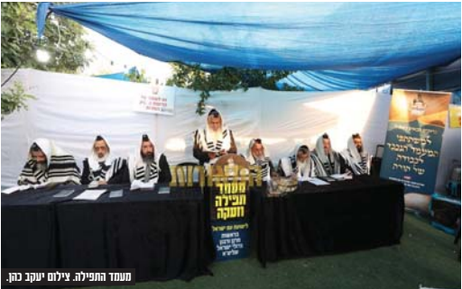
מחנה התפילה.

לרגל יום הילולתו של הצדיק פועל הישועות מעג'ור רבינו יצחק גבירא זיע"א שחל השנה בשבת קודש כ"א בתמוז, נערך ביום חמישי בבוקר לפני הילולתו מעמד התפילה המרכזי והמסורתי של 'המאורות' על ידי ציונו הקדוש.