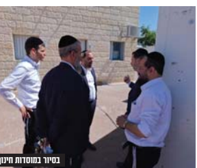
בסיור במוסדות חינוך

שכונות ופיתוח ציבור על מנת לפתוח את השנה בצורה הטובה ביותר. בהנחייתו של הרב אלמליח הוקם חפ"ק באגף החינוך בעירייה, חדר מצב שילוח בחודש הקרוב את כל הפעילות לפתיחת שנת הלימודים, ויתן מענה בזמן אמת לכל האתגרים העולים מהשטח.