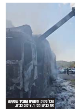
הגל פקוק. משאית החציר שפקקה את כביש מס' 1.

באיחוד הצלה אומרים כי מפגשים כאלה נותנים למתנדבים הזמן כוחות להמשיך פעילות הצלת חיים. "אנו מאחלים לעמית הרבה בריאות ושינוי צליל ריק משמחות".