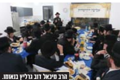
מחנה התפילה.