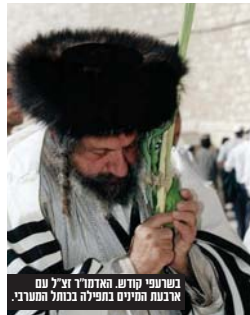
בשריית קודש האדמו"ר צוק"ל עם ארבעת המינים בתפילה בנחלת העשר

הלפרין צוק"ל ראש מנחם הסטנולטי הלכה. שלב מלא אהבת ישראל בבית לעלוב אינו חירוש אבל מידת טובו של רבינו אפילו בלעלוב חידוש הוא. משתתף היה בשמחתו של כל אחד מישראל בכל לבו נפשו, כאילו אחד הוא לו ממש, עצמו כבשרו. כשהגיע מאן דהו לבשר לו על שמחה בביתו צהלו פניו וצהבו מרוב שמחה, מברך את בעל השמחה מברכות פיוה, ואחר כך מבקש בענותותו שאף