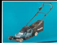
מכסחת דשא נטענת מקיטה דגם 18V 432 וק- 1299 ₪