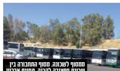
מחשף לשכונה מסוף התחבורה בין שכונת חפציבה לקריה. תמונת ארכיון

כי ציבור חילוני נרתע מלהתגורר בסמוך. אפנים אצל חורדים הבניה הוא אינה גורם, ראו את השכונות של סנהדריה לבית העלמין, או המרפסות הצופות לבית העלמין כאן, או הר נוף, שהנף והשקף מבתים רבים הוא הר המנוחות.