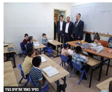
בישיבת עבודה עם משרד החינוך הרב חיים ביטון