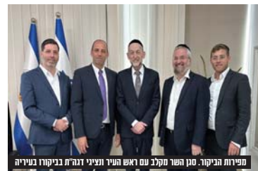
מפירות הביקור. סגן השר מקלב עם ראש העיר ונציגי דג"ח בביקורו בביתר

במסגרת הקווים הבין עירוניים, יתוגבר השירות לירושלים באופן משמעותי: בקו 680 הנוסע מרמה ד' ורוב"ש ה' לירושלים לבירה, כמו כן יוקם קו חדש קו 168 מהרמות החדשות רמה ד' ו' לשירות לביתר עלית, דבר שרבים מתושבי העיר וקוים לו