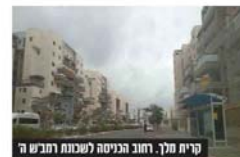
קריית מלך. רחוב הניסיה לשכונת רמב"ש ה'

עירונו שבשנים בתקופה זו, וכמנהג הרווח, הווגות הצעירים מבקשים להתגורר בסמוך להורים לפחות בתקופה הראשונה של שנה או כמה שנים, ואין כמעט להשיג דירות בשכונותיהם בעיר, אפילו לא במחירים/גגות ובשאר תנאים לא קלים, וכאמור, גם מחירי הדירות הגדולות הללו מאזורים שחוקים,