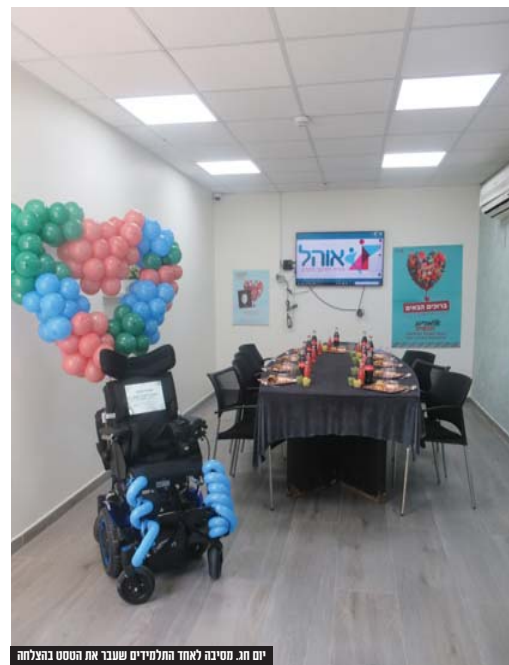
יום חג. מסיבה לאחד התלמידים שעבר את הטסט בהצלחה

ובבית שפר, בשעות נוספות של פיזיותרפיה, ריפוי בעיסוק ותקשורת. לכל צוות פרא רפואי מוצמדת סייעת שיקומית המתרגלת מדי יום את המטרות הדרושות לתלמיד בכדי להתקדם עוד ועוד.