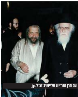
עם מרן הגרי"ש אלישיב צוק"ל