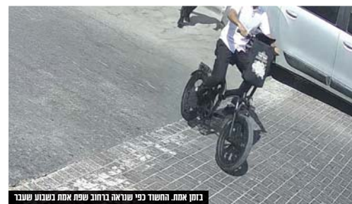
בזמן אמת. החשוד כפי שראה ברחוב שפת אמת בשבוע שעבר

"ראיתי אותו בשבוע שעבר נכנס לבתים ברחוב שפת אמת והזעקתי משטרה, אך עד שזו הגיעה הברנש כבר חמק וברח", מעדכן תושב הקריה את 'חדש'