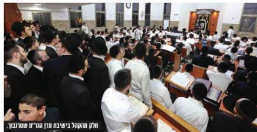
חלק מהקהל בישיבת מרן הגר"מ שטרנבוך