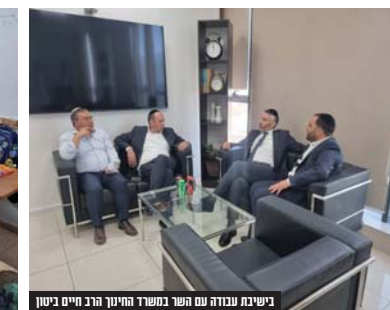
בישיבת עבודה עם משרד החינוך הרב חיים ביטון