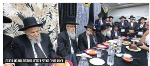
ראש העיר תצניי דוב"ח בשמחת השבוע ברכות