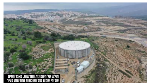
חולש על השכונות החדשות. מאגר המים של מי שמש מול השכונות החדשות בעיר