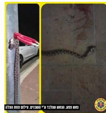
נחש צפע. הנחש שנלכד ע"י השכנים.

החמסין כידוע מוציא את הנחשים מחוריהם, וביום שני השבוע בשעות אחה"צ כונני מד"א - 'צוות הצלה' הוזעקו לרחוב נעמי שמש בביית שמש הוותיקה, בעקבות דיווח על אשה שהוכשה על ידי נחש.