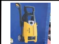
מכונת שטיפה 160 גולד ליין וק- 399 ₪

מבצע קיץ מטורף! מנגלים גז קולמן במחירים מיוחדים!