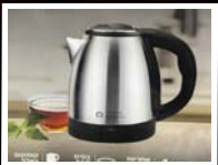
קומקום חשמלי מפואר 1500W 1.8 ליטר ניסוסה הכי זול בארץ! וק- 69 ₪