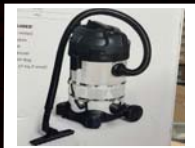
שואב אבק רטוב יבש 30 ליטר S-WHISHER וק- 550 ₪