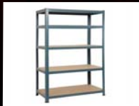
כוננית מפותרת וחזקה שילוב מחבת ועץ וק- 199 ₪