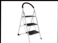
דרגש 3 שלבים מבית יעקבי וק- 149 ₪