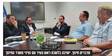
מדברים חינוך. ישיבה בלשכת ראש העיר עם נציגי משרד החינוך

אתגר פתיחת שנת הלימודים וקביעת סדרי עבודה לשנה הקרובה. ראש העיר הציף מספר פרויקטים שבוצעו לקדם בשנה הקרובה והשניים ימשיכו לקדםם בשיתוף פעולה.