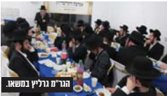
מחנה התפילה.