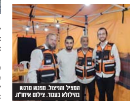
החיר והרצוף. תחנה חירוגית בהצלה.

שעות. "כיוולנו כבר להגיע בזמן הון למירון", טען אחד הנוסעים שהיה תקוע בפקק במשך שעות ארוכות.