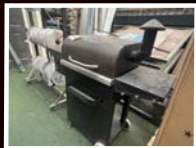
מעשנת הטובה בעולם של אמג'יני SUZUKI וק- 1950 ₪