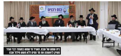
בית שמש של שבת. תאגיד מי שמש בתעודת רבני בעיר משקי לאוהבה את עד המים נלא חשש חילול שבת