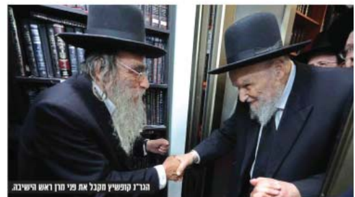
הגר"ם קופשיץ מקבל את פני מרן ראש הישיבה