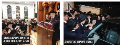
מרן ראש הישיבה במשא בהיכל ישיבת באר התורה

ראש הישיבה שליט"א פתח את ביקורו ההרומם בעירנו בשכונת חפציבה בישיבת 'כנסת מרדכי' לצעירים העומדת תחת נשיאותו, דבר בה על התורה שנועדה לדבקות בה' ויחבר והיה המדות של 'לנעשה ונשמע', בישיבת התפילה בעיריב ונשא כאומר שיחה מיוחדת לצעירי הצאן בני הישיבה לצעירים.