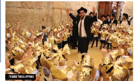
בחפילה בכותל המערבי.