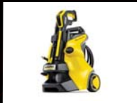
מכונת שטיפה K5 קרשר וק- 1790 ₪