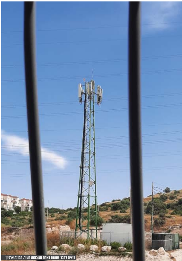
רועים לדבר. אנטנה באחת משכונות העיר. תמונת ארכיון

המוראיים התבקשו לציין אם כאשר ניסו להתקשר באמצעות טלפון סלולרי בבתם במהלך החודש שלפני הריאיון חוו תקלות (לא שמעו כראוי; השיחה נותקה באמצע עקב חוסר קליטה; לא הצליחו להתקשר או להוציא שיחה).