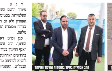
הרב אלמליח בסיור במוסדות החינוך המיוחד