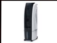
מזגן אוויר נייד טורבו גולד ליין וק- 499 ₪