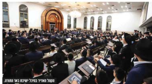
הקהל האדיר בהיכל ישיבת באר התורה