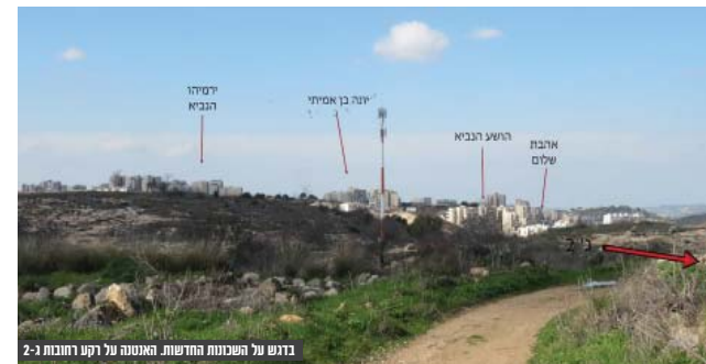
בדגש על השכונות החדשות. האנטנה על רקע הרחובות 2-1

"מתוך הרשויות שיש בידורן מידע לגבי טיב הקליטה הסלולרית (12 רשויות), ל-75% (רשויות) יש קשיי קליטה בכל שטחן או בחלקן. נמצא כי על פי נתוני משרד התקשורת