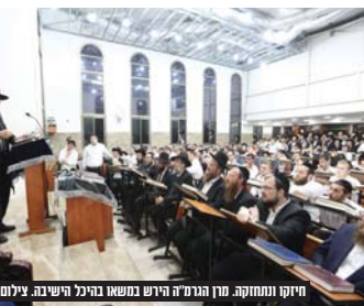
חיוזק ומתחזק. מרן הגרמ"ה הירש במשא בהיכל הישיבה.

וזה למעשה היה הצד השווה בין המרגלים לחורבן החסור רצון להירבך בחקב"ה, וזה עשוי אנטו צריכים להתחזק בבין המצרים בענין הזה של הרצון להירבך בחקב"ה ע"י לימוד התורה בתמורה גדולה ובין אדם לחבירו, ובעבודת התפילה וזה אנטו מתקברים להקב"ה, שזה היה נגד החורבן, שהגיע בגלל חסור הרצון להתקרב אליו ונגזר שיתרבה בבוד שמים והקב"ה יעורר שונק לאוהלה השלמה במהרה בימינו אמן.