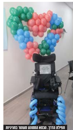
חפילת הדרך. הבסא הממונע מעטר בחגיגות

שאלתי את אחד מאנשי המקצוע של מרכז שפר, וההסבר: "במרכז השיקומי 'שפר' שואפים לקדם כל ילד וטל מלבד לעצמאות מקסימלית בחיי היום יום. על מנת להגיע למיקסום היכולות הנהלת שפר מתגברת את הטיפולים הפרא רפואיים בבנים