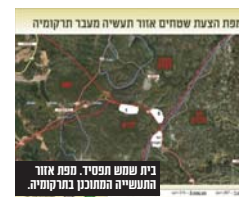
בית שמש חפציו. מפת אזור התעשייה המתוכנן בקרבת אזור.

בית שמש השלום בירושלים האריך את מעצרו בארבעה ימים. "אתמול בשעה 18:30 המשיב התחזה לחייל מילואים וגנב נשק מבסיס צבאי תוך גרימת נזק לרכוש צבאי באותו בסיס. מדובר, לכאורה במעשה חמור, במיוחד בשים לב לכך שהצבא נמצא בכוננות שיא והמדינה במלחמה, אוסף לכן שהמשיב שומר על זכות השיקוף, כתב בהחלטתו השופט מוחמד חאג'י-חיא. מהדוברות נמסר: "עקבות המקרה, נפתחה