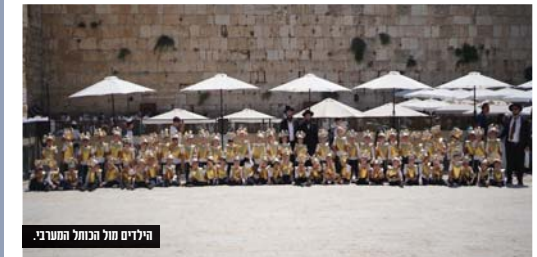
הילדים מול הכותל המערבי.