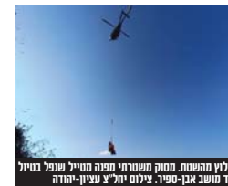
חילוצו מהפסח. מסוק משטרהי ממה מטייל שנפל בסיוול ליד מושב אבן-ספיר.

טיולים לא תמיד נגמרים עם חיוכים: מתנדבי יחידת החילוץ עציון-יהודה של משטרת ישראל יחד עם שוטרי מחוז ירושלים פעלו בשעות אחר הצהריים של יום ראשון בשתי גזרות במקביל, בפעילות לחילוץ מטיילים שנקלעו למצוקה בהרי ירושלים. במקרה הראשון תייר מארצות הברית בשנות העשרים לחייו, נקלע למצוקה בעת שטייל בסמוך למושב זנוח הסמוך לבית שמש, לאחר שאספקת המים שלו אזלה. כוחות מג"ב מותחת המשטרה מטה יהודה יחד עם מתנדבי יחידת החילוץ עציון-יהודה הגיעו אל המטייל בעומק השטח הסבו. השוטרים והמתנדבים העניקו לו מים קרים וחילצו אותו כשהוא תשוש ואינו מסוגל להמשיך בדרכו, באמצעות רכב 4*4 לאחר כנן חולץ לרכבו בכדי שיוכל להמשיך בדרכו בצורה בטוחה.