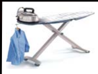
קרש גיהוץ לוטוס כתר וק- 199 ₪