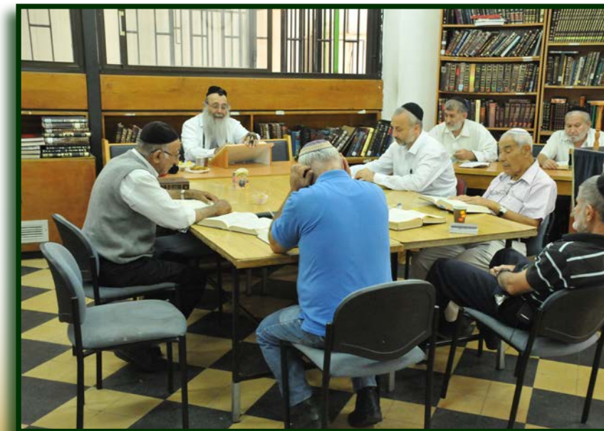
שיעורי תורה וקירוב לבבות