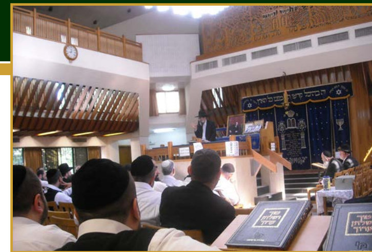
מורינו הרב שליט"א בשיעור בהיכל בית הכנסת

פעילות מיוחדת עם בני נוער, שלא היו רגילים למקומות תורניים, וחשקה נפשם בתורה. עבורם נפתחו מסגרות מתאימות מידי יום, המאפשרות להם להכיר ולטעום ממתיקות התורה.