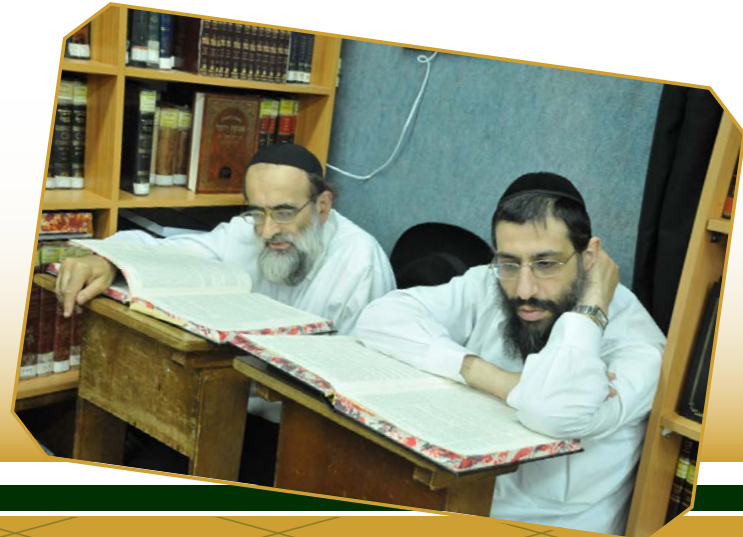
מורינו הרב שליט"א בכולל האברכים שע"י המוסדות

גולת הכותרת של מוסדות בית יעקב, הינה ללא ספק כולל האברכים הגדול, בראשו עומד מורינו הרב שליט"א. בכולל הגדול עמלים בתורה הקדושה בטהרה, למעלה ממאה אברכים מופלגים בתורה ויראה. בכוללים מגוון מסלולי לימוד: הוראה, ש"ס ועוד.