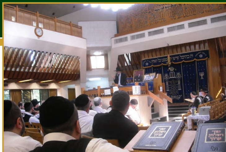
מורינו הרב שליט"א בשיעור בהיכל בית הכנסת