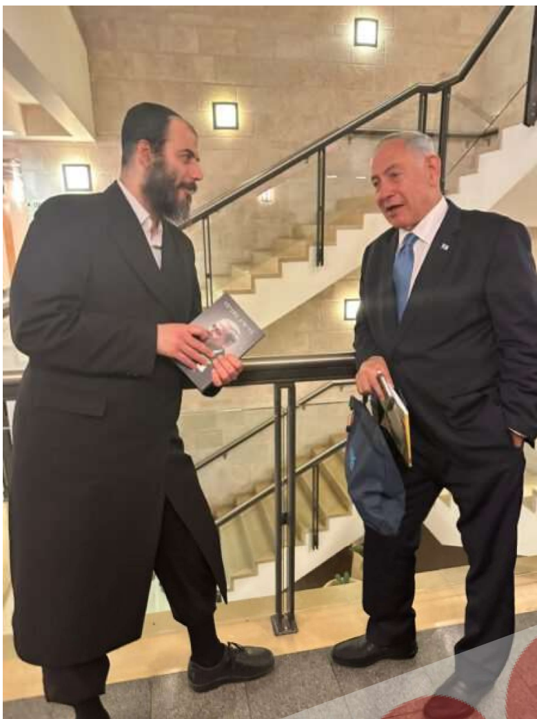
נתניהו רואה בו חלק מהכוחות ברחוב בלפור. רה"מ ועוזרם החרדי של ח"כ הסיעה המרכזית