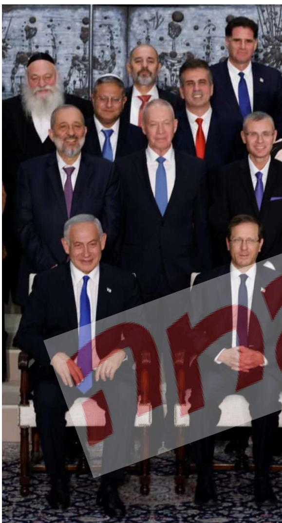
המון חריקות בדרך, ואזעקות לפתרון המשבר באמצע הלילה. התמונה המסורתית של הממשלה הנבחרת בבית הנשיא

"כל אחד מאיתנו עשה את תפקידו בנאמנות. כיום אני מתמקד בסיוע לאנשים ונהנה מאוד מכל רגע".