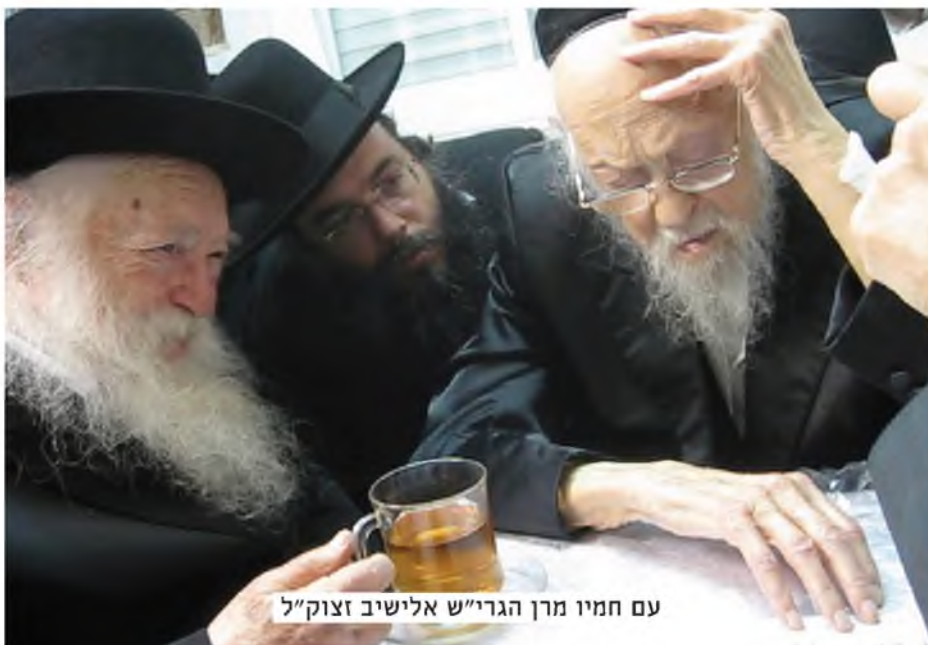
עם חמיו מרן הגרי"ש אלישיב זצוק"ל

אחד הנכדים שמע מהרבנית ע"ה דוגמאות מזהירות של רבינו מכל חשש איסור ריבית (כגון שמחזיק חשבון רק בבנק הדואר שאינם נותנים אשראי וממילא אין אפשרות לריבית). פעם אחת כיבדו אותו להיות סנדק, ושלחו רכב שיביא את הרב לברית. הנהג היה בעל תשובה. רבינו ירד מביתו לנסוע והרכב לא נסע בשום אופן. עד שרבינו נאלץ לעבור לרכב אחר. בדיעבד התברר כי אביו של בעל התשובה, רכש מכונית זו מכסף ריבית,