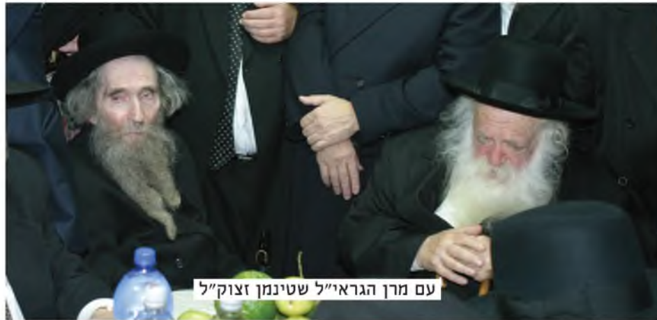
עם מרן הגראי"ל שטיינמן זצוק"ל