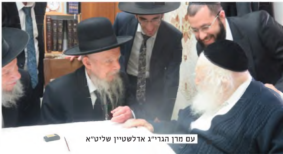
עם מרן הגרי"ג אדלשטיין שליט"א

רבינו נשאל - עד היכן הגבול הדק בין מותרות לקיום הכרחי? והשיב מיד כי הדברים מפורשים במשנה ברורה ושער הציון סימן קנ"ו. "כי על האדם להתבונן בעצמו מה הוא הכרח אמיתי שאי אפשר בלעדיו וכך